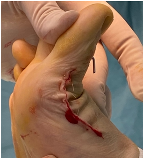
Figura 4. Rango de dorsiflexión en postoperatorio inmediato.

herida a las 3 semanas postoperatorio y el zapato postoperatorio a las 4 semanas de operado y se exige dorsiflexión máxima. Se realiza control radiológico a las 6 semanas postoperatorio y se refiere a rehabilitación si la movilidad no es satisfactoria en ese control.