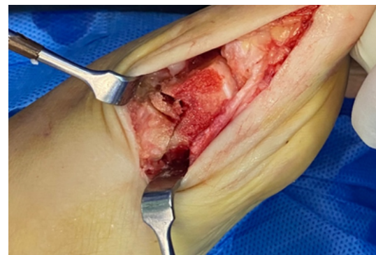
Figura 2. Corte doble en metatarsiano distal para acortar y descender la cabeza del mismo luego de queilectomía extensa.

Por último, se procedió a realizar artroplastia de interposición liberando proximalmente de forma parcial la capsula articular, la cual se interpone entre la cabeza del metatarsiano y la falange, y se fija plantarmente a la base de la falange con sutura 3-0 reabsorbible. Luego se afronta el resto de la cápsula dorsal y plantar longitudinalmente y se realiza cierre de piel (figura 3). Finalmente se prueba el rango de dorsiflexión alcanzado (figura 4).