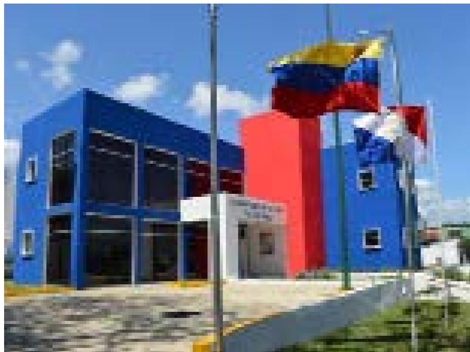
Figura 2. Laboratorio "Dr. Felix Pifano", en San Felipe Estado Yaracuy. Nuevo Centro para el Diagnóstico de la Covid-19 en Venezuela

que esta decisión no se tomó, porque el conocimiento científico de la COVID-19 sugiriera que tenía menos consecuencias, sino porque el Reino Unido se estaba quedando sin equipo de protección personal (EPP). La enfermedad tuvo que ser degradada para que los ministros eludieran la responsabilidad legal de proporcionar EPP de alta calidad.