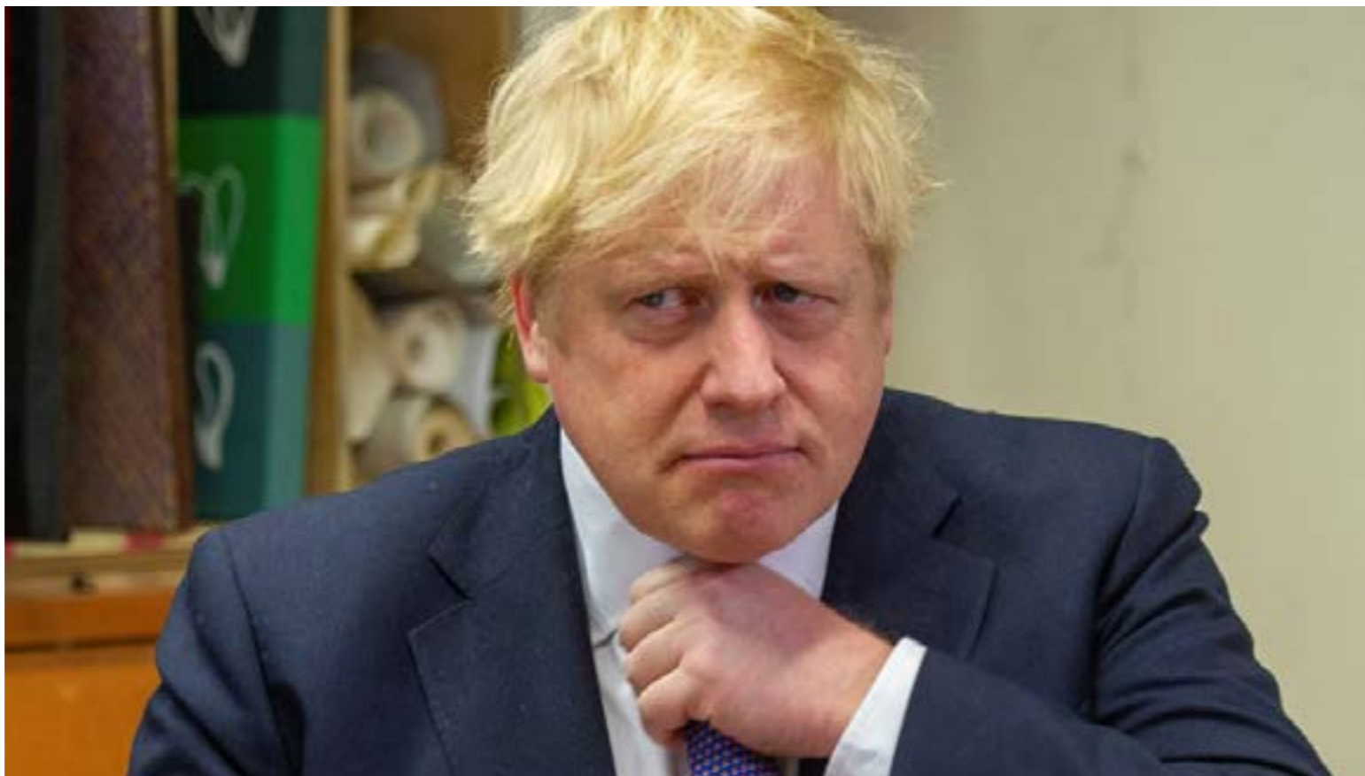
Figura 1. A pesar que el primer ministro del Reino Unido, Boris Johnson, declaró el 13 de marzo que estaba impotente ante el coronavirus y le dio prioridad a la economía, el tiempo le quitó la razón, mucho más rápido de lo que esperaba, incluso, enfermó y estuvo hospitalizado por el coronavirus.

( 1 ), corriéndose el riesgo de dar estimaciones que no se correspondan con la realidad. Tal es el caso que se ha presentado en la República Bolivariana de Venezuela, donde la Academia de Ciencias Físicas, Matemáticas y Naturales, en su segundo informe sobre la situación del Covid-19 en Venezuela , extrapolaron valores de casos y fallecidos que no se llegaron a presentar. Según el modelo y los supuestos, utilizados por ellos, alcanzaríamos en Agosto-Septiembre 7.000 casos diarios y en los últimos tres meses del año, pudiésemos llegar a 14.000 casos diarios. En relación a los fallecidos, estarían alrededor de 200 diarios, considerando además que, los reportes