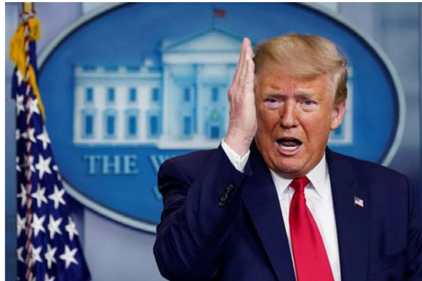
Figura 3. El presidente Trump, hablando en la Casa Blanca (14 de Junio): "Hoy, le estoy dando instrucciones a mi administración para que detenga el financiamiento a la Organización Mundial de la Salud mientras se realiza una revisión para evaluar el papel de la Organización Mundial de la Salud en el mal manejo y el encubrimiento de la propagación del coronavirus ... La confianza de la OMS en las declaraciones por parte de China, probablemente causó un incremento de 20 veces en los casos en todo el mundo, y puede ser mucho más que eso. La OMS no ha abordado ni una sola de estas preocupaciones ni ha proporcionado una explicación seria que reconozca sus propios errores, de los cuales hubo muchos ... tanta muerte ha sido causada por sus errores".

El 5 de enero, la OMS describió una "neumonía de causa desconocida" en sus noticias oficiales sobre el brote de la enfermedad. Ya el 7 de enero, los científicos chinos habían identificado al agente causante como un nuevo tipo de coronavirus. La secuencia genética de este nuevo virus fue compartida el 12 de enero. Para esa fecha se informaron mas detalles sobre la enfermedad, se notificaron y explicaron los primeros 41 casos, los síntomas empezaron a producirse en estos pacientes el 8 de diciembre. También el 12 de enero, la OMS informó que "no había evidencia clara de transmisión de persona a persona". En relación a esto que ha sido tomado tan controversial, por el presidente Trump y otros políticos, como un engaño. La OMS informó los hechos tal y como estaban apareciendo, e informaron antes del 14 de enero, que la transmisión