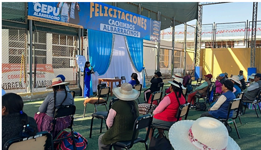
Figura 2. Ejecución del programa de intervención.

Para la gestión de datos, se elaboró una matriz en Microsoft Excel en la que se codificaron las respuestas y se evaluó su consistencia antes del análisis estadístico. Después, se empleó el software estadístico SPSS, versión 26, para realizar análisis descriptivos e inferenciales. Para el análisis descriptivo, las puntuaciones se clasificaron en tres niveles (bajo [24-31], moderado [32-38] y alto [39-46]) calculados a partir de terciles, lo que permitió una interpretación comparativa del cambio pretest-postest. Esta categorización se empleó únicamente con fines descriptivos y no clínicos.