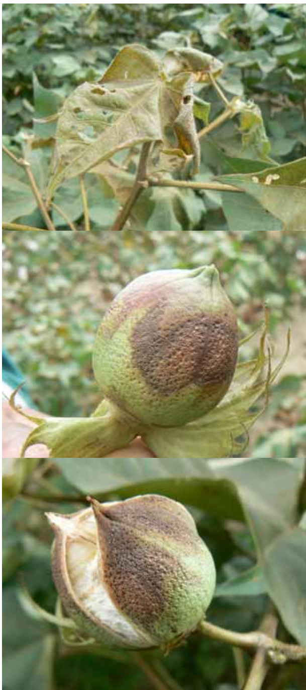
Figura 2. Daño de Scirtothrips dorsalis sobre cápsulas de algodón en diferentes estados de desarrollo.

y maní en la India, entre otros (Hodges et al. 2005; Collins et al. 2006). En Venezuela ha sido citado en vid ( Vitis vinifera ) (Quirós et al. 2007) y ahora en algodón ( Gossypium hirsutum ).