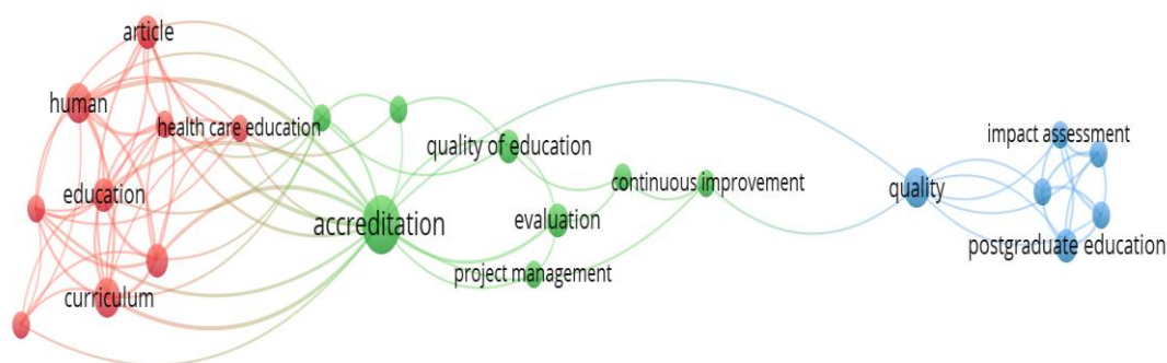
Figura 2. Co-ocurrencia de palabras clave

Nota. Procesamiento realizado por los investigadores con VOSviewer Versión 1.6 de 2023.