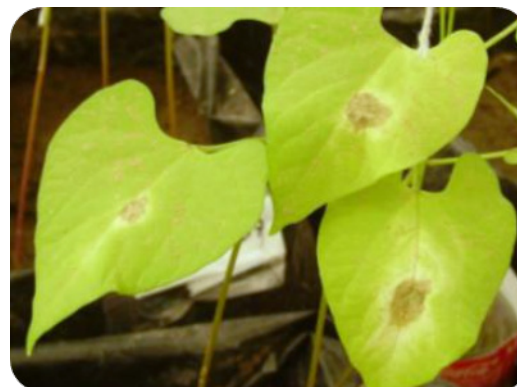
Figura 2. Síntomas de la enfermedad por Xanthomonas phaseoli en lámina foliar a partir de los puntos de inoculación.

ambas variables durante el avance de la enfermedad (Figura 3). En las Figuras 4 y 5 se muestran los resultados de algunos genotipos representando las tendencias observadas en las accesiones evaluadas para el desarrollo de la enfermedad, medido por el tamaño de la mancha (mm) y por el área foliar afectada (%), respectivamente.