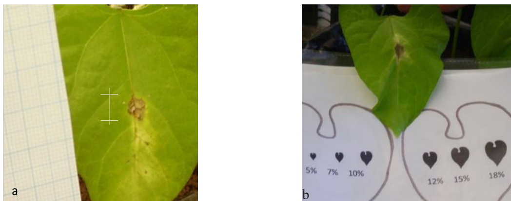
Figura 1. Medición de la mancha en lámina foliar a partir de los puntos de inoculación (a) tamaño, (b) porcentaje de área foliar afectada.

Finalmente, con los datos obtenidos se realizó un Análisis de Varianza (Fisher, 1966) para ambas