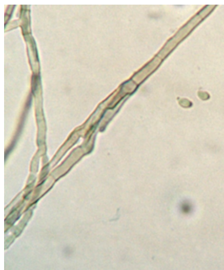
Figura 1. Examen directo de una porción del lente de contacto con KOH al 20 % (40X) donde se observan hifas ramificadas y tabicadas dematiáceas.

El lente de contacto fue troceado en porciones pequeñas con bisturí estéril en campana de flujo laminar, se realizó examen directo con KOH al 20 % (40X) observándose hifas delgadas y tabicadas ligeramente demateáceas (Figura 1). Las porciones restantes fueron sembradas en agar Sabouraud dextrosa (Oxoid-USA) con gentamicina, agar Mycosel (Oxoid-USA) y agar papa (Oxoid-USA) e incubadas a 28 °C junto con la placa de agar sabouraud más gentamicina que venía ya sembrada con la muestra de la secreción corneal realizada por el médico oftalmólogo; para observarse semanalmente por 30 días. El cultivo bacteriano fue sembrado en agar Sangre (Oxoid-USA), agar GC