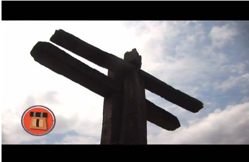
Cruz del perdón