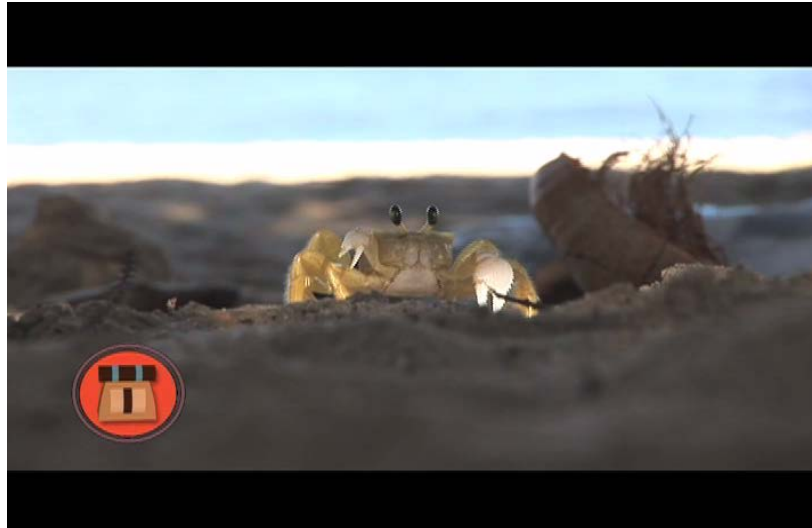
En la playa de Chuao