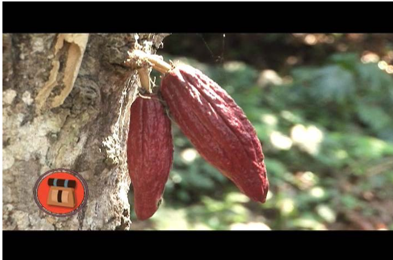
Cacao de Chuao