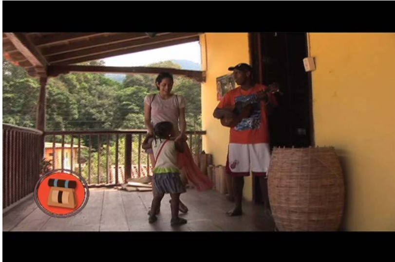
Compartiendo con la comunidad