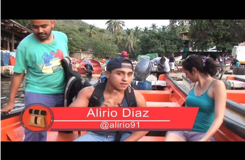
Presentación inicial en cámara