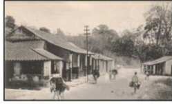
Vista de Sabana Grande tomada desde Bello Monte V.Almijana. N. E, Estudio Caracas 1990 P.37