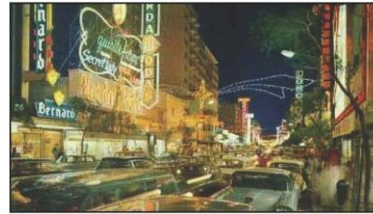
"Bulevar de Sabana Grande". Santiago de León de Caracas. 1567-2030. P.245