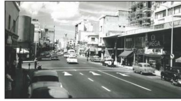
Edificio "Los Andes" 1970. Recuperado de viejas fotos actuales. 2007