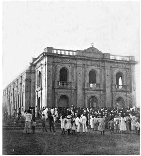
Figura 2: Consagración de la fábrica para servir de catedral (2 de febrero de 1928).