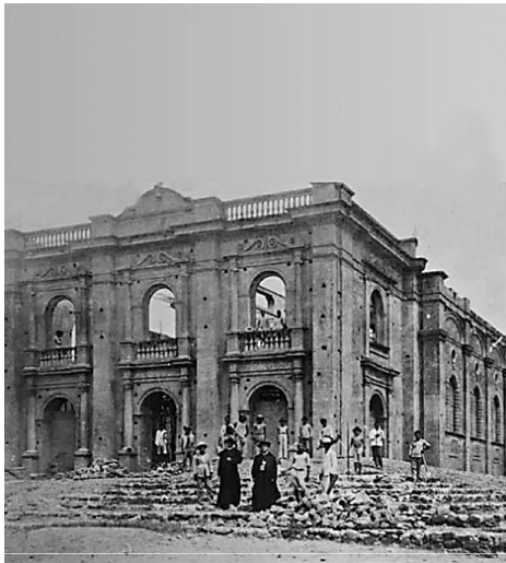
Figura 3: Reinicio de las obras de la "nueva iglesia parroquial" (circa 1928).