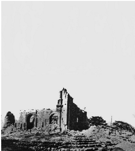
Figura 4: La fábrica en ruinas después del terremoto de 1929.