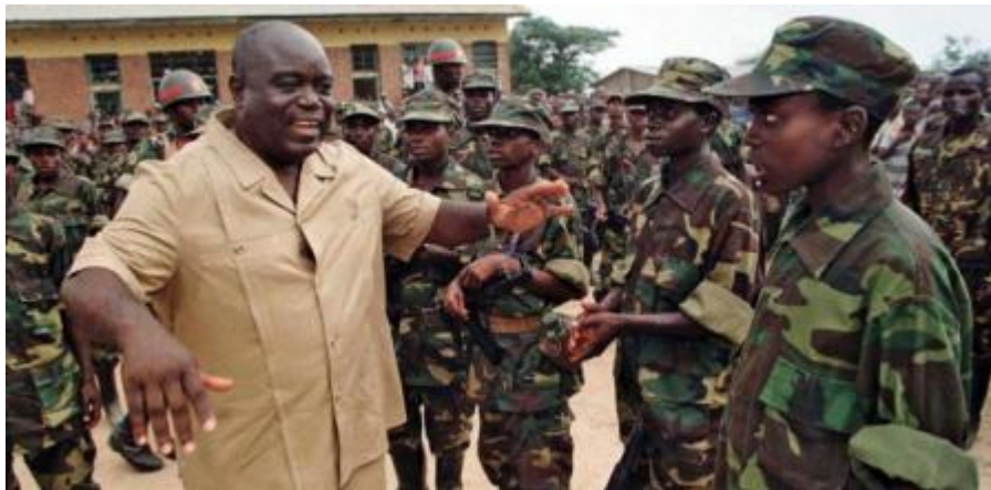
Imagen No. 1 Laurent-Désiré Kabila, junto a sus kadogos, los niños soldados de su ejército de liberación 247

En otro orden de ideas, un aspecto importante de mencionar es que a medida que la guerra se fue desarrollando, varios grupos militares comenzaron a adueñarse de las minas de minerales y metales preciosos, adquiriendo grandes ganancias de ellas, lo que generó que poco a poco se fuera perdiendo el interés de perseguir al enemigo. Se podría decir, que la guerra pasó a un segundo plano en relación a la minería ilegal, convirtiéndose en el verdadero objetivo el mantener el control de los centros mineros. Asimismo, a causa de la abundancia que representaba la explotación de los recursos, se dio un punto de quiebre en cuestión de derechos humanos, debido a que los distintos grupos comenzaron a reclutar a niños soldados.