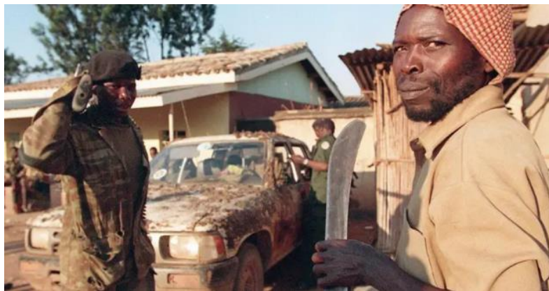
Imagen No. 2 Los milicianos hutus recibieron listas con los nombres de los tutsis que debían matar junto con todas sus familias 269

Mencionado genocidio fue estrictamente organizado, incluso varios investigadores creen que fue planificado durante años, su método de acción se basó en la persecución de los tutsis por medio de listados de opositores, en donde las personas que aparecían allí eran asesinadas mayormente con machetes junto a sus familiares, de hecho, la difusión de odio estuvo tan efectiva que hasta “vecinos mataron a otros vecinos e incluso hubo maridos que mataron a sus esposas tutsis, diciendo que si se negaban, serían ellos los que morirían.” 268