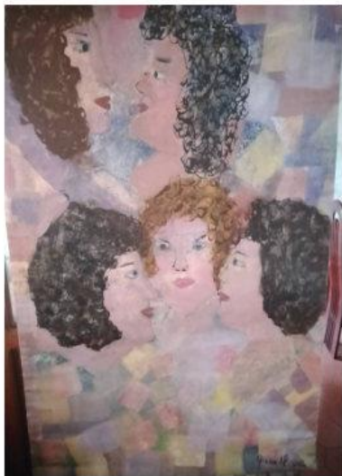
Gracie de P. Conversando Acrílico / lienzo Año 2006. 96x65 Maracaibo Estado Zulia