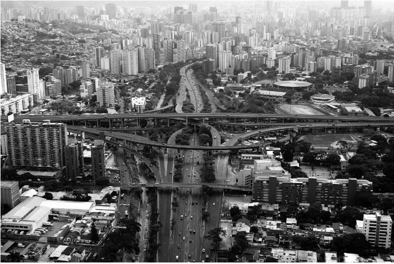
Figura1. Ejemplo del desarrollo de la red vial en Caracas. Distribuidor La Araña.

Las divisiones funcionales y sociales del espacio no son independientes, sino que se determinan mutuamente y fundamentan la idea en la cual, la ciudad no puede usarse por todos sus habitantes en igual condición.