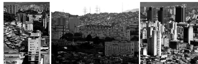
Figura 5. Ejemplos de la informalidad en el crecimiento general de la ciudad.

Ello da cabida a entender a la ciudad contemporánea de Caracas inserta en la descripción que hiciera Nogué (2009, p. 21) de la construcción social de la ciudad cuando la define "como un producto social, fuertemente impregnado de connotaciones culturales e interpretado como un dinámico código de símbolos que se refiere a la cultura de su pasado, de su presente y tal vez, también de su futuro." Así, con las relaciones socio-espaciales que transforman el territorio, se