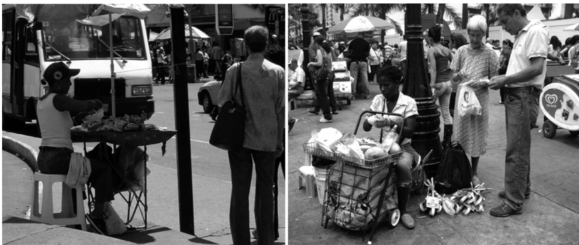
Figura 2. Ejemplos de apropiación del espacio público para el comercio informal. Avenida Urdaneta, 2012.