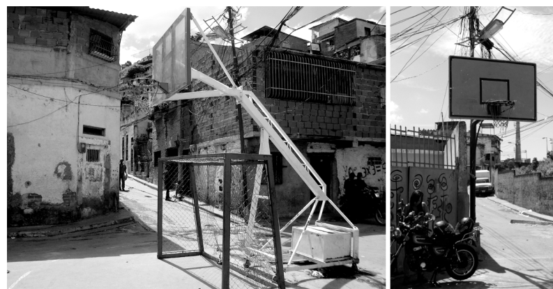
Figura 4. Ejemplos de inserción de dispositivos como equipamientos para realizar actividades deportivas.

Las transformaciones que experimenta la ciudad demuestran una capacidad infinita de respuesta, sin límites de innovación, asociado a la autonomía de las intervenciones individuales. De esta manera, la ciudad no parece mostrar un proyecto urbano legible, y más bien, parece moldearse a tenor de las acciones y reacciones que se plantean con las distintas operaciones urbanas, es decir, no queda fija en el tiempo ni parece estar definida espacialmente.