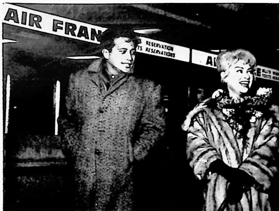
Vemos en la gráfica a la popular actriz del cine francés Martine Carol en el momento que se dispone a tomar el avión que la llevará a los paradisíacos escenarios de Tahiti, donde descansará durante seis meses.