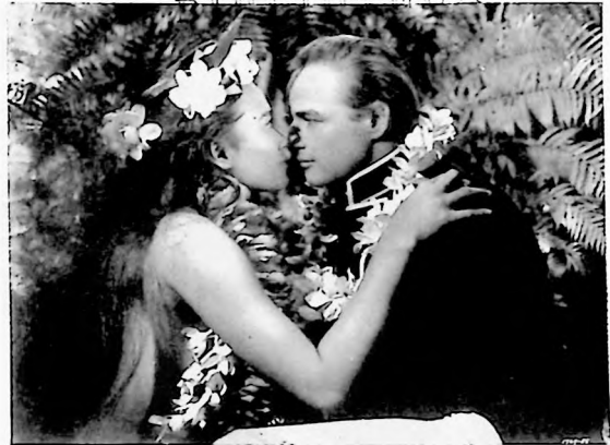
Marlon Brando, como Fletcher Christian, en una escena de amor con Tarita. El éxito de esta joven como actriz ha sido tan grande que los Estudios de la Metro la han contratado por largo plazo.

—Magnani y yo éramos excelentes amigos mientras trabajábamos juntos en "El hombre en la piel de vibora". Después la cosa cambió. Un día, ella me llamó y me dio a entender que contaba con mi galantería para que, sobre todo en Europa, su nombre apareciera en cabeza del reparto. A mí me daba lo mismo, así