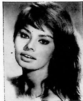
Sofia Loren... siempre bella

El atuendo favorito de Sofia, sin embargo, no es un vestido sino una larga capa con capucha forrada de piel a cabeza con piel de lince ibérico. La piel es costosa por lo rara, y además va a constituir una confortable protección contra los hela-