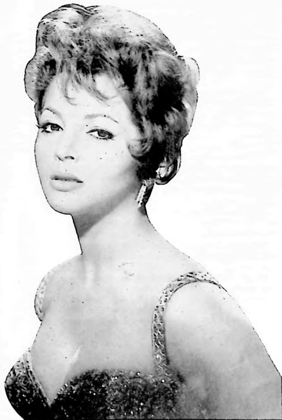
Sarita Montiel, con su estilo personal y belleza, sigue siendo una de las actrices más taquilleras del cine español. Su último éxito lo constituye el film "La Bella Lola", una versión libre de la famosa obra "La Dama de las Camelias".

Desde aquella "Misión blanca" ha llovido lo suyo. Sarita se convirtió en Sara. Y ahora, en plena madurez del estrellato, diríamos, casi, casi, que nos ha confiado un poco sus penas.