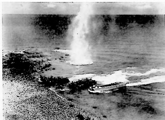
Escena del desembarco, una de las más espectaculares del film de Darryl F. Zanuck "El día más largo del siglo"

La realización de esta película representa, para Ryan, muchos años de labores. Asistió personalmente al desem-