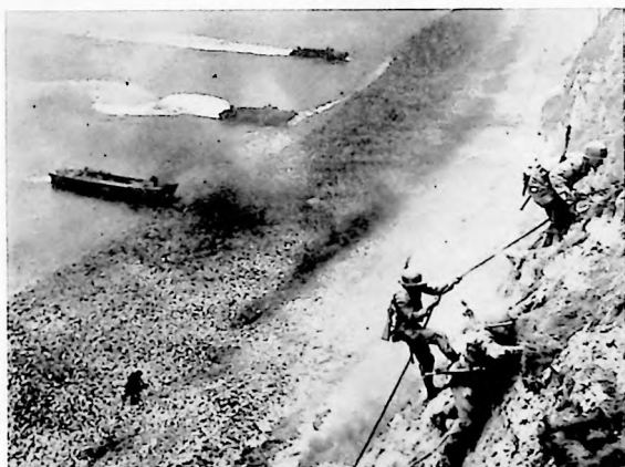
Para captar momentos como el que muestra la foto, los camarógrafos tuvieron que arriesgar la vida en más de una oportunidad

Cuando se publicó la noticia informando de la próxima realización de "El Día Más Largo del Siglo", miles de cartas, procedentes de todas las partes del mundo, incluso de Alemania, llegaron a Ryan, firmadas por antiguos combatientes, quienes deseaban participar sus experiencias propias. Sin embargo, Ryan es muy escrupuloso y no incluyó incidentes ni en su libro ni en el film, sin haberlo comprobado antes. "No hace falta la imaginación de nadie en esto", dijo. "El Día D es un caso real más extraño que la ficción. Es una de las más dramáticas historias de nuestra época."