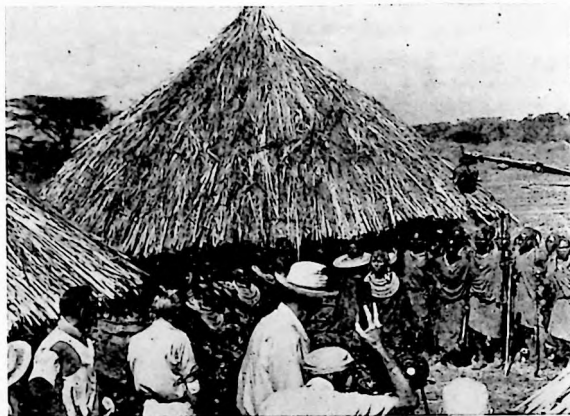
Esta escena corresponde al film "Hatari", película que trata sobre la caza de animales y que fue rodada en el Africa salvaje, teniendo en el reparto a John Wayne, Elsa Martinelli, Hard Kruger y Gerard Blain, entre otros.