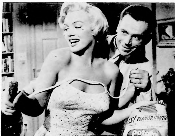
Una escena de la película "Comezón del Séptimo Año".

En 1954 contrajo segundas nupcias con el jugador de "base balls" Joe Di Maggio, del que se separó nueve meses más tarde. Volvió a Nueva York, al "Actors Studio" y allí encontró al escritor Arthur Miller. Era su gran amor. Miller, dramaturgo célebre y uno de los