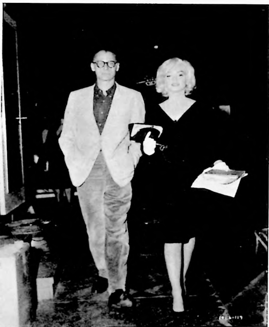
El matrimonio Marilyn-Miller, deambula por la ciudad igual que suele hacerlo cualquier otra pareja de menos popularidad artístico-literaria o de mayor alcurnia económico-social.

En cuanto a las actuaciones artísticas de Marilyn Monroe todavía hay mucho que hablar. Mucho y bueno. En breve se calmará el escándalo que han armado acerca de su lamentable desaparición y, entonces, al margen de la calentura pu-