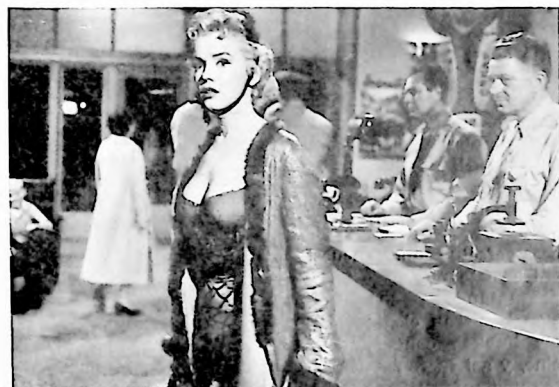
El título de la película nos dice que nunca fue santa, sin embargo en esta ocasión muestra muy pocas "intimidades".

Véase la elegante figura de Marilyn en una escena de la película "Tempestad de Pasiones", donde destaca su temperamento artístico sin necesidad de recurrir a exhibiciones estilo "boite de nuit".