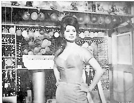
De nuevo el binomio Sophia Loren-Vittorio De Sica se unen en la secuencia que lleva por título "La Rifa", realizando una labor digna de toda clase de elogios.