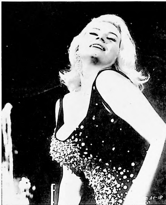
Por obra y gracia del director Federico Fellini, veremos a la exquisita Anita Ekberg bajo proporciones gigantescas en el episodio "Las tentaciones del Dr. Antonio", en la gran película "Boccaccio 70".

"Boccaccio 70" pretende, en forma inegñiosa, ser la clase de cosa que el gran Florentino hubiera escrito, si hubiera añadido un día a los diez del "Decameron" en Italia, en 1970. Los directores Federico Fellini, Luchino Visconti y Vittorio De Sica, contribuyen cada uno con una historia en esta realización en tres partes.