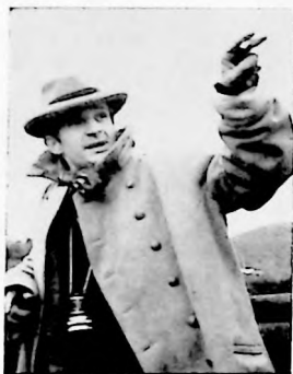
Francois Truffaut, realizador francés, considerado por el C.C.C.C. como el mejor director del año.

No ha sido tarea fácil la que han llevado a cabo los cronistas y críticos de cine en el veredicto correspondiente a 1962. Muchas películas de buena calidad y de modernos enfoques han requerido un estudio minucioso y no pocas discusiones.