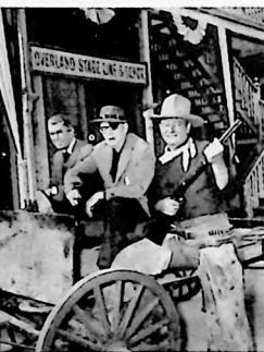
James Stewart, John Ford y John Wayne.

—Ford sabe de antemano lo que desea y sabe