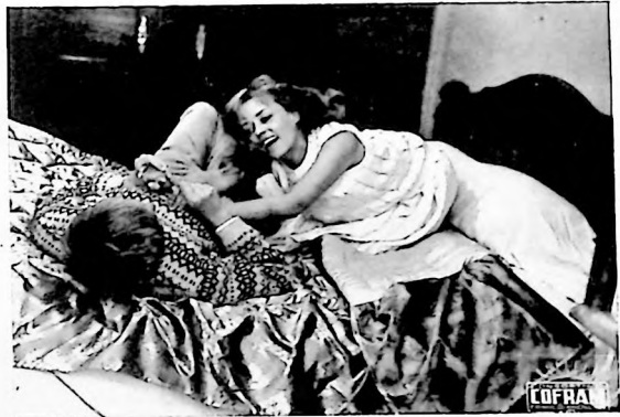
Una simpática escena del film de Truffaut "Una mujer para dos" (Jules y Jim) considerada como una de las diez mejores películas del año y cuya actriz Jeanne Moreau se hizo acreedora del galardón a la mejor actriz.

También los Críticos premiaron la labor de Alain Resnais, precisamente por su film galardonado, como "el mejor director". Designaron a Emmanuelle Riva, heroína de "Hiroshima mi amor", la mejor actriz, y a James Stewart por "Anatomía de un asesinato" como el mejor actor.