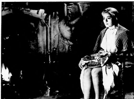
Una secuencia de "Viridiana", el film de Buñuel cosechador de numerosos trofeos internacionales a los que hay que añadir el "Cantaclaro" venezolano.

Desde 1956 y para premiar las películas del año anterior, se establecieron 10 premios: cinco "Cantaclaro" y cinco diplomas. La estatuilla premió la mejor película norteamericana, "Marty", de Delbert Mann; Italia obtuvo el trofeo por "El amor se paga", realizada por seis directores diferentes; la mejor película inglesa "Romeo y Julieta", de Renato Castellani; la etiqueta francesa estuvo representada por "Rififi", de Jules Dassin, y la mejor de habla española "La muerte de un ciclista", de Bardem. Los diplomas se repartieron entre "Las Diabólicas", de Clouzot; "Robinson Crusoe", de Buñuel; "Frutos Salvajes", de Hervé Bromberger; "Carmen de Fuego", de Otto Preminger,