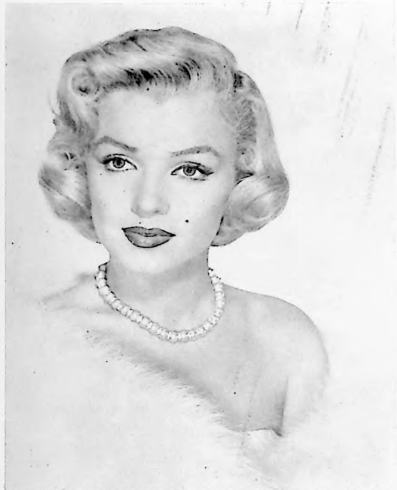
Pudo llamarse señora Dougherty, a continuación señora Di Maggio y posteriormente señora Miller, pero gracias a su indiscutible personalidad nunca dejó de ser la admirada y admirable Marilyn Monroe.

mejores escritores de su generación, se convirtió en el dios y el genio tutelar de la estrella. El 29 de junio de 1956 se casaron en White Plains, cerca de Nueva York. Marilyn se convirtió al judaísmo, la religión de su marido, y todo el mundo siguió con atención la transformación de la bella.