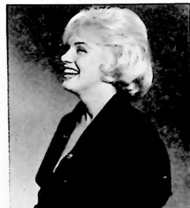
Marilyn Monroe, nació para el arte y allí triunfó al amparo de su encantadora sonrisa

"Venezuela Cine", naturalmente, también está de duelo.—F. G.