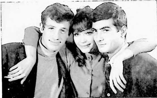
Otra película premiada por el C.C.C.C. ha sido "Una mujer es una mujer", de Jean-Luc Godard e interpretada por Jean-Paul Belmondo, Anna Karina y Jean-Claude Brialy.

En el año 1959 la selección del Círculo de Cronistas de Cine, abarcó diez títulos: "Un rey en Nueva York"; "Noches de Cabiria", "Patrulla infernal", "La mujer de negro", "Torero", "Cuando pasan las grullas", "Ascensor para el cadalso", "Patrulla de choque", "Noche larga y febril" y el documental criollo "Llano adentro".