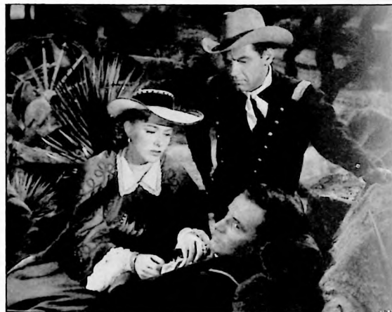
...como nos lo muestra la película "Hombres o Bestias", interpretada por William Holden y Eleanor Parker.