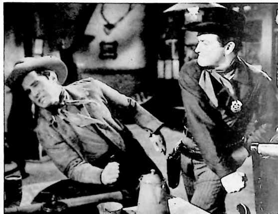
...Robert Taylor y la nueva actriz Patricia Owens, en una historia que provoca situaciones violentas, imprescindibles en un "western".

que iba al rescate; venía después un subtítulo: "Auxilio en camino".