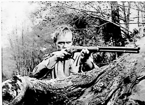
...en tierras hostiles arriesgando mil veces su vida. "La Última Carreta" narra uno de estos episodios bajo la interpretación de Richard Widmark.

unos cuantos. Algunos de estos actores han vuelto a regresar por televisión.