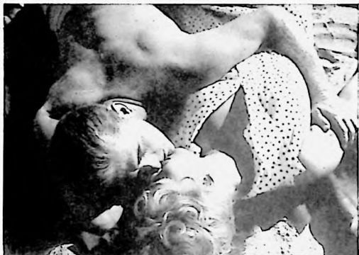
Una de las historias más atrevidas que ha logrado filmar Hollywood es "Vecinos y Amantes", con Kirk Douglas y Kim Novak en los roles estelares.

Es muy interesante notar la diferencia entre Kim Novak, la vampiresa del día, que es bella y no quisiera serlo, y sus antecesoras que eran bellas sin negarlo, ni avergonzarse de ello.