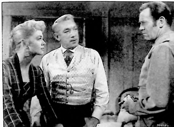
...donde además del conocido actor citado intervienen Anthony Quinn, Dorothy Malone, Dolores Michaels y otros.

tarde regresó nuevamente para que se rodaran las secuencias interiores de la película.