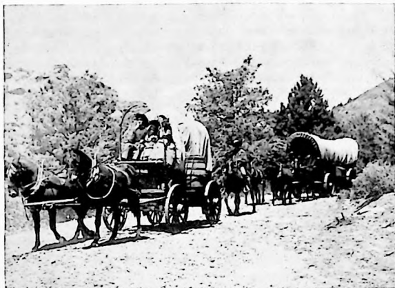
La carreta es otro elemento muy característico en este género de películas. Fue el carronato de todo colono que se aventuró...