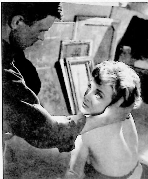
En la película se reúnen dos famosos actores europeos, Hardy Krüger y Micheline Presle, en uno de los papeles más importantes de sus carreras artísticas.

¡Próximo Sensacional Estreno en Caracas!