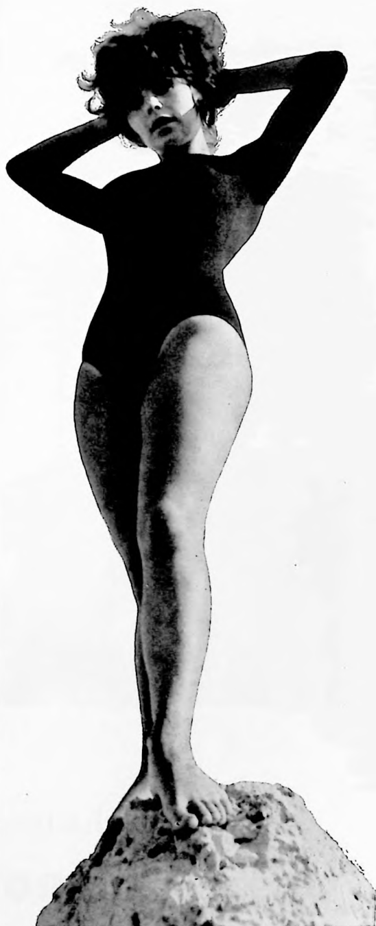
Revelada en "Los Tramposos" por el director Marcel Carné, he aquí a Pascale Petit, que desde entonces se ha convertido en una de las actrices de más actualidad no sólo de la pantalla francesa sino del mundo entero.