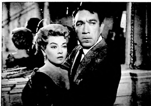
Anthony Quinn y Lana Turner en una escena de "Retrato en Negro".

Intérpretes: Lana Turner - Anthony Quinn - Sandra Dee John Saxon - Lloyd Nolan y Richard Basehart