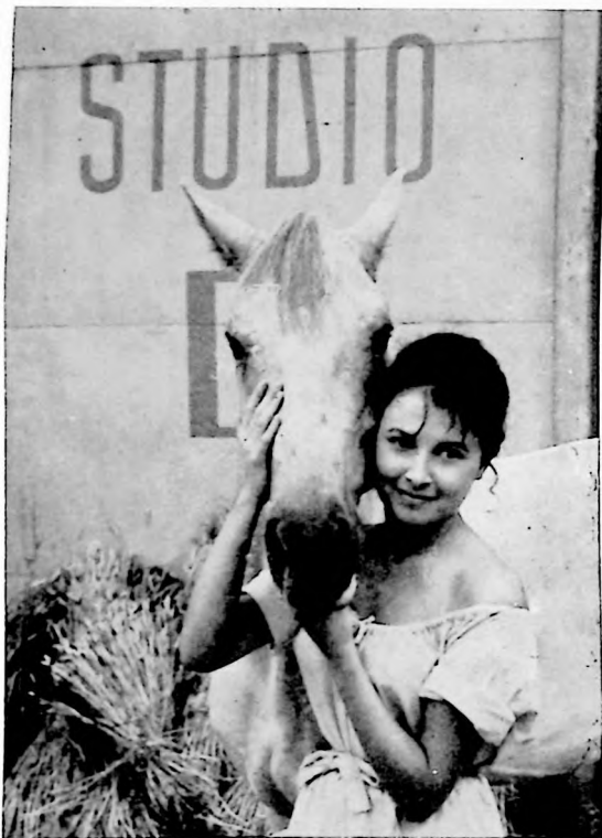
La nueva actriz Valerie Lagrange tiene a su cargo el papel central del episodio "La Virginidad", que forma parte de los siete capítulos del film "La Francesa y el Amor".