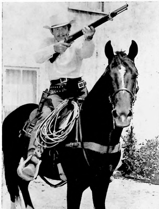
Clark Gable, al igual que muchos otros actores, ha interpretado diversos tipos de personajes del Oeste. Aquí lo vemos en la película "Estrella del Destino".

De hecho, durante la filmación de la película citada, Anderson se cayó del caballo y llegó a disgustarse tanto con todo lo relacionado a la producción que se rodaba, que tomó el primer tren a su alcance y se regresó a Nueva York. Más