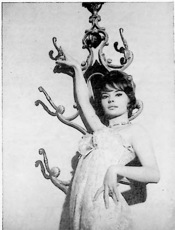
Su clase y su gracia están en consonancia con su cuerpo y su espíritu femenino.