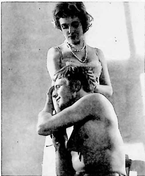
"Deseo y Destrucción" es un film que, sin lugar a dudas, supera todos los romances y misterios producidos por el cine británico.

Nota importante: Recomendamos que no cuenten el final ni a sus amigos, para que éstos puedan disfrutar la emoción de seguir paso a paso la trama de este drama, que les dejará profunda huella.