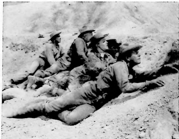
Los indios salvajes, sus batallas contra los blancos, los cerros de muerte, son cosas que tampoco escapan al cine del Oeste...