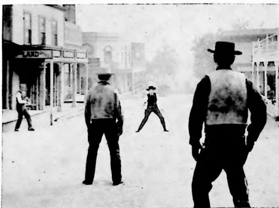
Una escena característica del "western", donde el héroe es acorralado para demostrar su rapidez en el manejo del revólver que le salvará la vida.