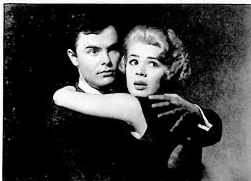
John Saxon y Sandra Dee en otra interesante secuencia de la misma película.

GRAN ESTRENO 12 DE OCTUBRE Castellana - París - Boyacá