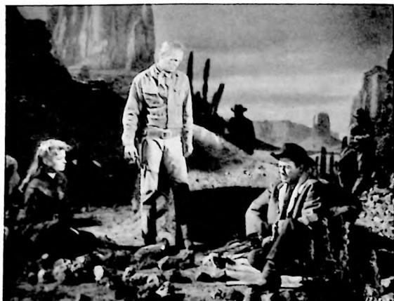
"El Tesoro del Ahorcado", otro film de los seleccionados para el Festival, reúne a actores como Richard Widmark...