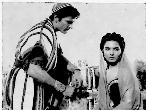
Una gráfica de "La Historia de Ruth", donde vemos a Elana Eden con el joven actor Tom Tryon.