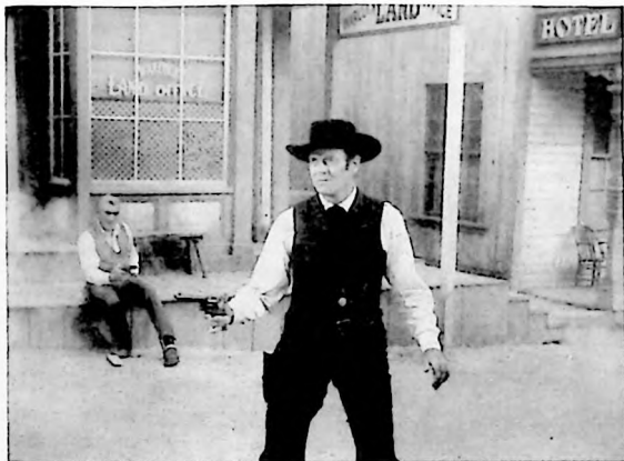
Henry Fonda interpreta un difícil papel en la cinta "Pueblo Embriajado", film plerótico de acción...