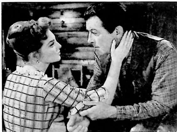
Robert Taylor y Julie London forman la pareja central de "Furia Maldita"...