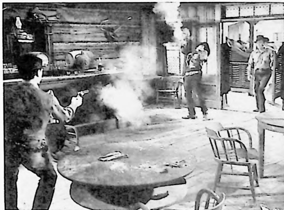
...donde también se revela un nuevo actor, John Cassavetes, a quien vemos en acción en esta gráfica.