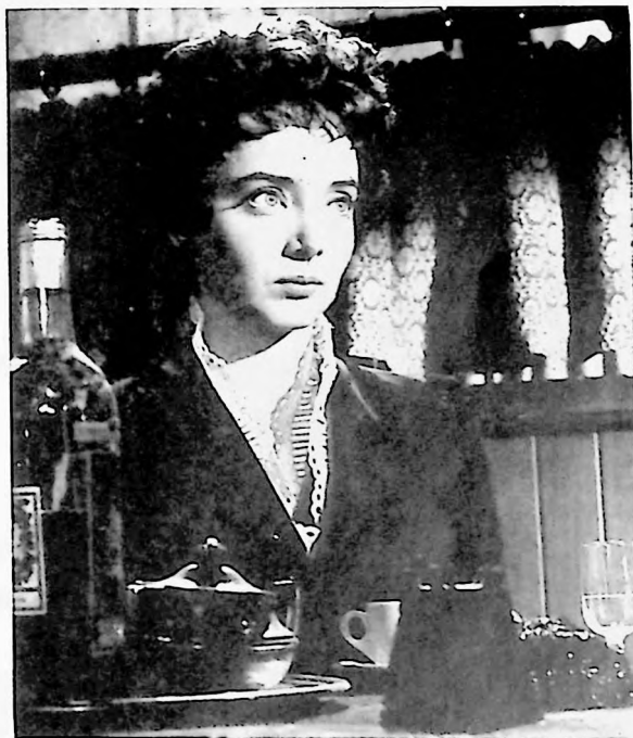
Una escena del film de John Sturges, "El Último Tren", donde vemos a Carolyn Jones. La película, uno de los mejores "western" vistos últimamente, incluye en el reparto a Kirk Douglas y Anthony Quinn.