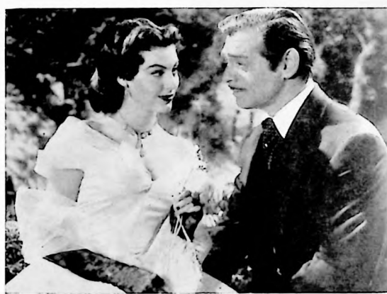
Otra escena del film "Estrella del Destino", donde Clark Gable es el héroe central y Ava Gardner la bella heroína. El idilio nunca falta en un film del Oeste.