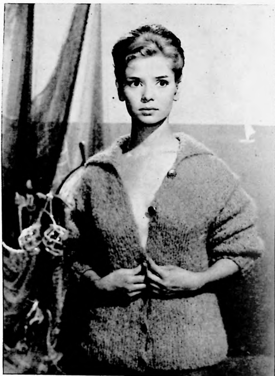
Marie-José Nat, otra revelación de la moderna cinematografía gala, interviene a la cabeza del reparto incluido en el capítulo de "El Matrimonio".