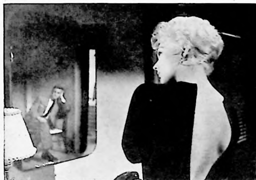
Richard Quine, director del film, ha logrado escenas pasionales en extremo como las que presentamos en ambas gráficas.