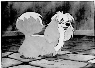
El mágico mundo de los dibujos de Disney, ¿llegará en verdad a desaparecer del cine?