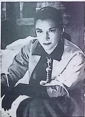
La gran actriz María Casares es la estrella de la realización de Jean Cocteau "ORFEO", que se exhibirá desde el 21 en el Metropol

"LA ISLA DEL PLACER" , es un film para el cual hubo de traer la Paramount tres jovencitas inglesas desde su país, una de ellas es la simpática: Joan Elan.