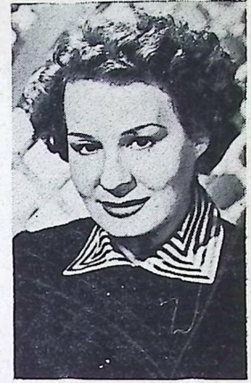
La película "SIN RASTRO DEL PASADO" recibió el premio a la mejor película dramática y su protagonista Shirley Booth el de la mejor actuación femenina

Los grandes triunfadores del Festival, han sido Francia y España.