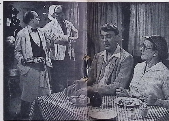
Los tres grandes premios de Cannes fueron: Gran Premio Internacional del Film, a la película "EL SALARIO DEL MIEDO", de H. G. Clouzot; Premio de la Crítica Internacional (fuera del Jurado), a la película "LAS VACACIONES DEL SR. HULOT", de Jacques Tati, y el Gran Premio Internacional del Corto-metraje, al film: "CRIN BLANCA", de Albert Lamorisse.