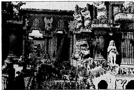
La obra de Griffith "Intolerancia" señala el punto de conversión del cine en verdadero arte

La influencia de Intolerancia en el desarrollo posterior del cine abarca todos los aspectos de este mágico producto del ingenio y la técnica de siglo XX. En lo industrial Intolerancia marcó el comienzo de la subdivisión administrativa que hoy gobierna con precisión matemática toda la complicada maquinaria de producción. Aún cuando el propio Griffith ideó y supervisó todos los detalles de producción, desde el libreto, que solamente se conocía porque lo llevaba en la cabeza, hasta la tarea final de distribución, que también debió organizar él mismo ante la negativa de los distribuidores establecidos, es lógico que un hombre no habría podido entonces ni ahora hacer frente solo a una producción en que se gastó la fantástica suma de $1.750.000 (cuyo equivalente proporcional hoy serían $25.000.000); que duró en rodaje dos años largos, y en cuya actuación participaron no menos de 65 "es-