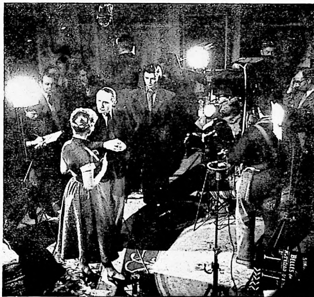
El realizador René Clair, en medio de Martine Carol y Gerard Philippe, da instrucciones bajo los "Sun lights" de "Beldades Nocturnas"

La etapa actual de René Clair es un regreso a lo estrictamente poético-humano. Sus últimos films "El Silencio es Oro" y "Beldades Nocturnas" demuestran no nuevos caminos sino nuevas precisiones, casi definiciones. El segundo de los films nombrados es una evasión de la realidad. La angustia de encontrar algo lejano creyendo que no lo tenemos al lado nuestro, nos da la tesis sencilla y valiosa de que lo presente vale la pena de vivirlo y de que no hay que pensar tanto en el pasado, que como se aparece en estampa se ve mejor. Con este tema sin complicaciones René Clair juega con la verdad, con la mentira y con los mismos personajes, conduciéndolos al través de mundos estilizados, dentro de un clima poético, elevado.