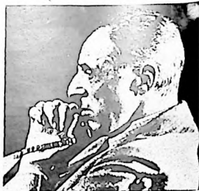
El cine norteamericano y el cine en general deben mucho a la figura de David W. Griffith

El gran primer plano (close-up) y el rápido montaje emocional que comúnmente se atribuye a los maestros rusos del período revolucionario, así como la movilidad de la cámara atribuida a los maestros alemanes del veinte, fueron empleados por Griffith en el Nacimiento de una nación y más sistemáticamente en Intolerancia , como elementos típicamente cinematográficos no derivados de otra forma conocida. A Griffith se debe el primer intento por introducir en el cine un vocabulario retórico equivalente al que poseen la literatura y la poesía. La estilización, la abstracción de detalles humanos o de objetos inanimados como símbolos, el contraste rápido de situaciones, el paralelismo de acciones análogas en distintas épocas, todo esto da a entender muy claro que el principio de la idea elemental trascendiendo lo puramente narrativo, ya era conocido por Griffith años antes que los rusos lo tomaran por base de su dialéctica cinematográfica. En el epílogo, ejemplo máximo de síntesis comparable a la coda de una gran sinfonía, la composición pictórica de prisioneros que se debaten impotentes contra una inmensa pared cuya vastedad se