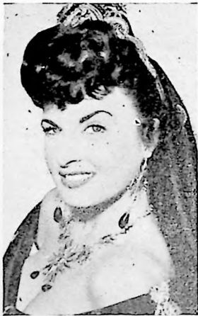
No ponemos comentario con el nombre: Silvana Pampanini, y lo que está a la vista basta