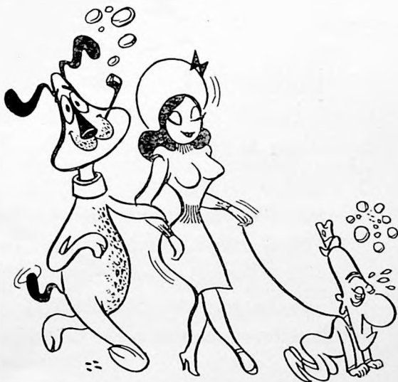
“Traición de Mujer”