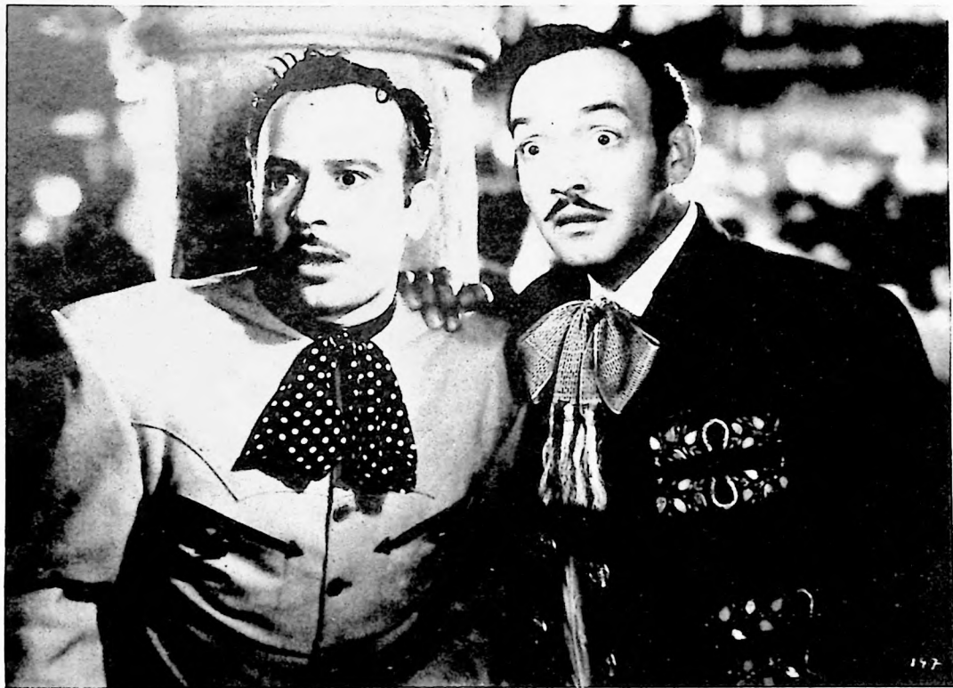
Pedro Infante y Jorge Negrete, charros por excelencia del cine mexicano

para definir el personaje en películas futuras. La prostituta de esta historia es una mujer provinciana que luego de ser vilmente engañada por un hombre rico, no tiene otra salida que ejercer la prostitución muy a pesar de sus principios morales. Sufrir