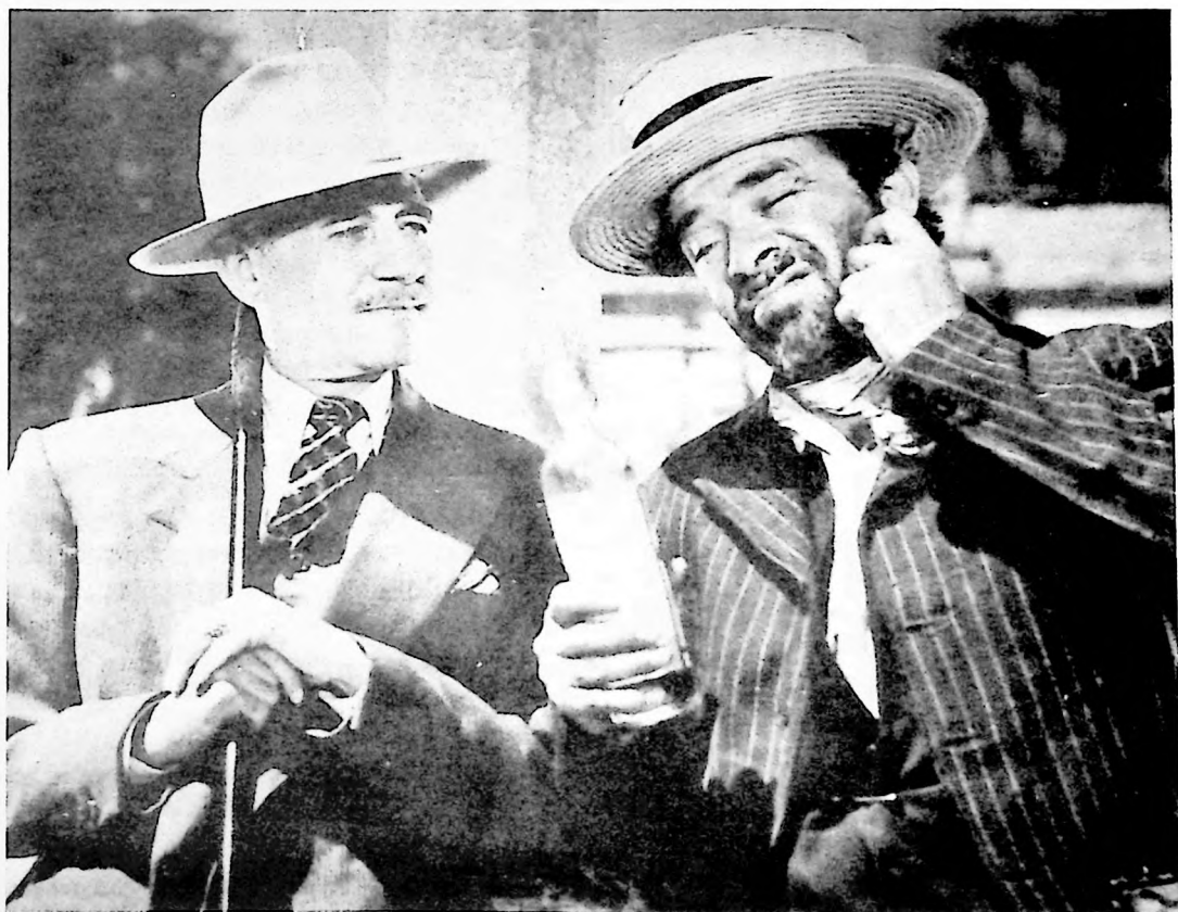
Andrés Soler y Tin Tan en Las Aventuras de Pito Pérez (1956) de Juan Bustillo Oro.

En el universo cinematográfico mexicano también resaltaron otros cómicos, entre ellos Emma Roldán, Fernando Soto "Mantequilla", Jesús