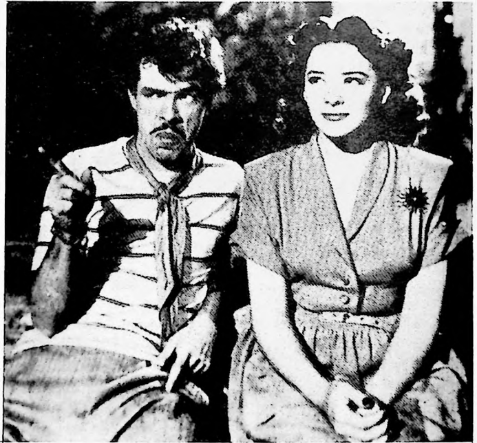
Tin Tan junto a Silvia Pinal en El Rey del Barrio , de Gilberto Martínez Solares

Para el año 1934, en ¿Quién mató a Eva? (comedia un tanto inadvertida), surgió un nuevo cómico Carlos López "Chaflán"; quién junto al