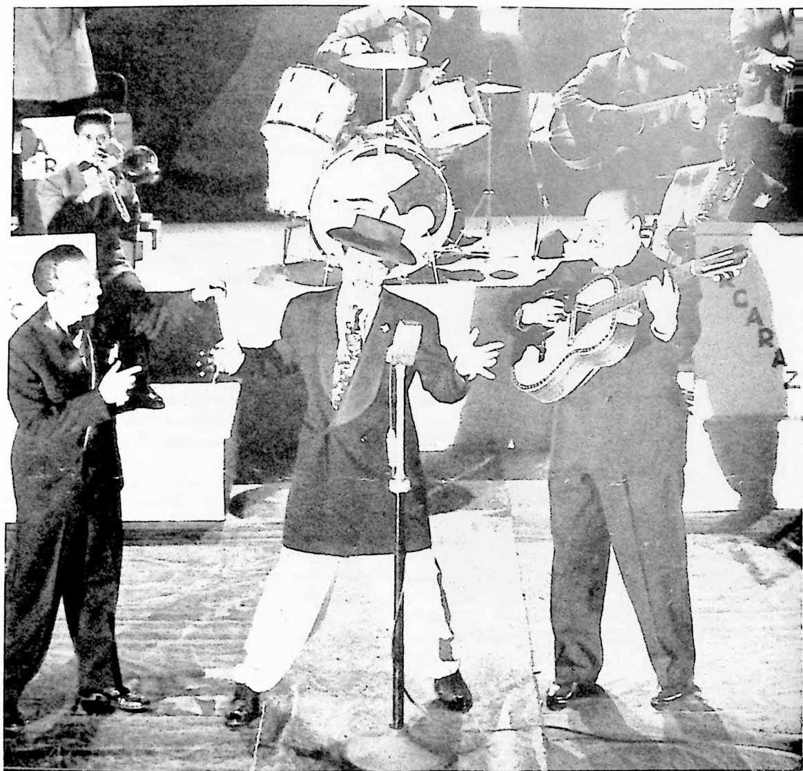
Tin Tan cantando en la Orquesta de Luis Arcaraz

Cuando el gobierno de Avila Camacho ofreció apoyo al cine mexicano condicionándolo a ciertas imposiciones ideológicas como lo fueron, la obligada exaltación de lo nacional y de la mexicanidad y la prohibición de subrayar las diferencias entre patrón y bracero; se afianzó lo que