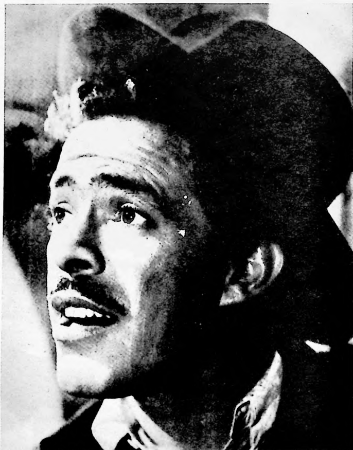
Germán Valdés Tin Tan en sus comienzos

La imagen masculina por excelencia de este género fue Arturo de Córdova. Formado como galán de radionovelas, pasa al cine con su engolada y