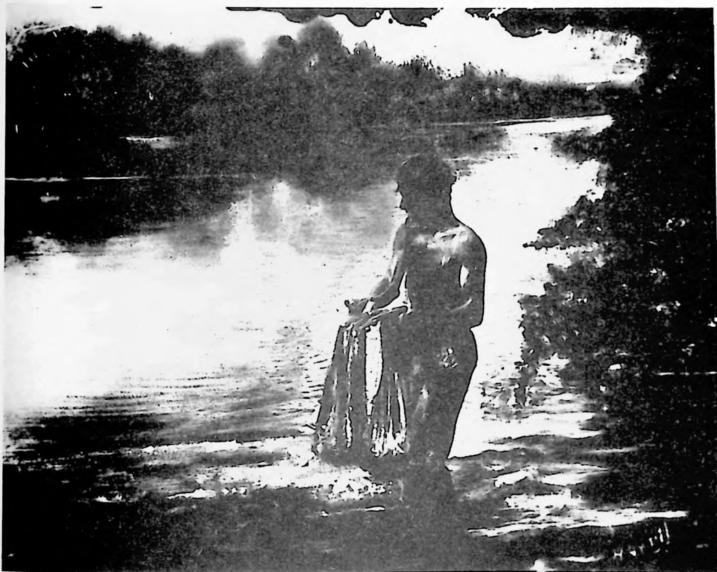
H. Abril. Fotografía que recoge costumbres venezolanas. (Reproducción: Vladimir Sersa).