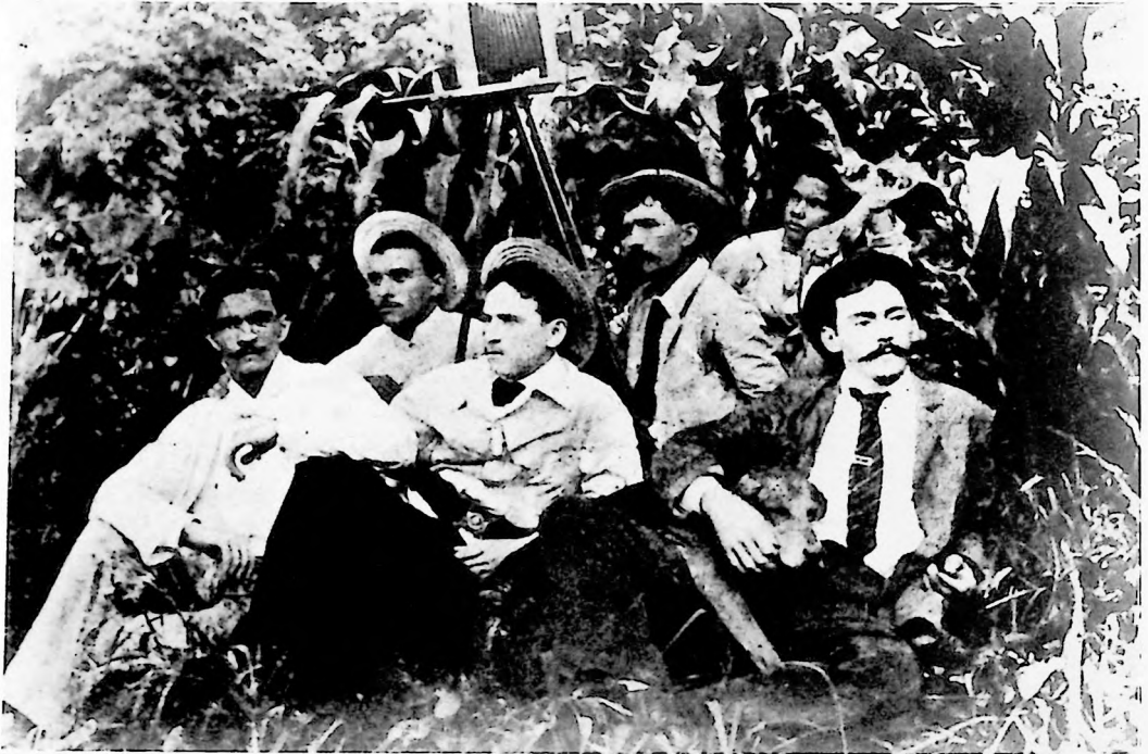
El Club Daguerre. 1896.

por los trabajos suyos que con frecuencia publicamos en nuestras páginas". Esta nota es de la edición de 1896.