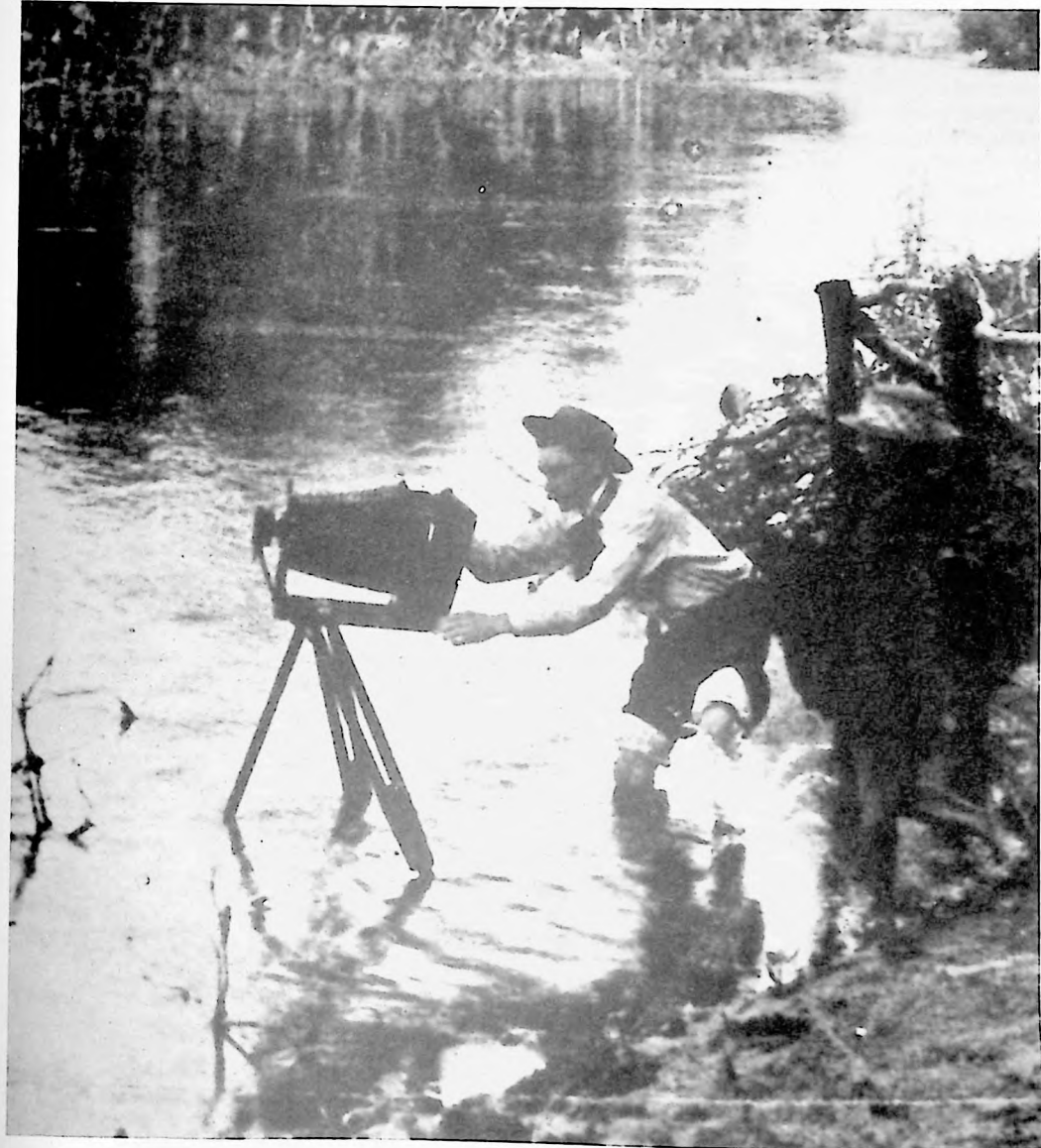
Detalle de portada