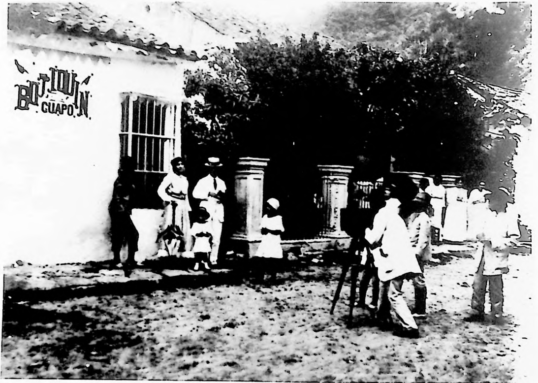
El registro de lo cotidiano.