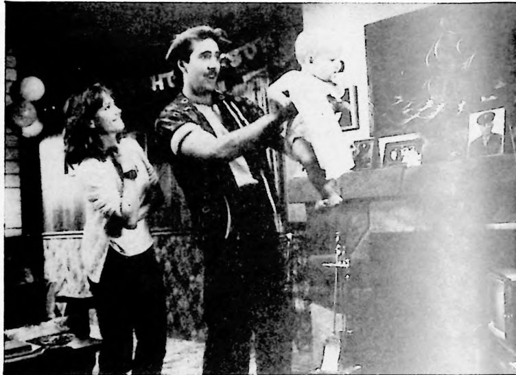
Holly Hunter y Nicolas Cage en Educando a Arizona

Los planos de la puesta en escena son panorámicos. Su fotógrafo, Barry Sonnenfeld utiliza los colores primarios con estilo shakey can (cámara trepidante) que empleaba a menudo Sam Raimi y Gus van Sant al inicio de Drugstore Cowboy . Parecería que los Coen se apoyaran en una técnica con el propósito de "vampirizar" (18) los viejos films.