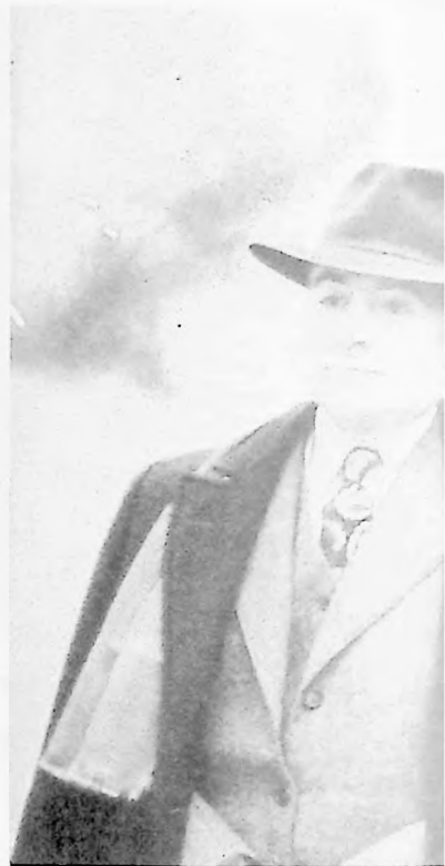
Encuentro con la muerte (Miller's Crossing)

En Encuentro con la muerte los Coen quisieron contar "una historia de amistad, de caracteres, de ética" según lo dice uno de sus personajes hablando frente a los cuatro mafiosos. (Recordemos la similitud posterior en Reservoir Dogs de Quentin Tarantino al comienzo del film cuando alrededor de una mesa de restorán los gangsters que no se conocen hablan de otros aspectos, aunque más triviales sobre por ejemplo, Madonna). Parecería contradictorio que un gangster se exprese en términos de ética, de lealtad, pero este submundo se rige por códigos intrínsecos, verbigracia la omerta (mafia, camorra napolitana), ese pacto y ese poder de la palabra, la inviolabilidad del compromiso que Mario Puzo tan certeramente describió en sus "Padrinos".