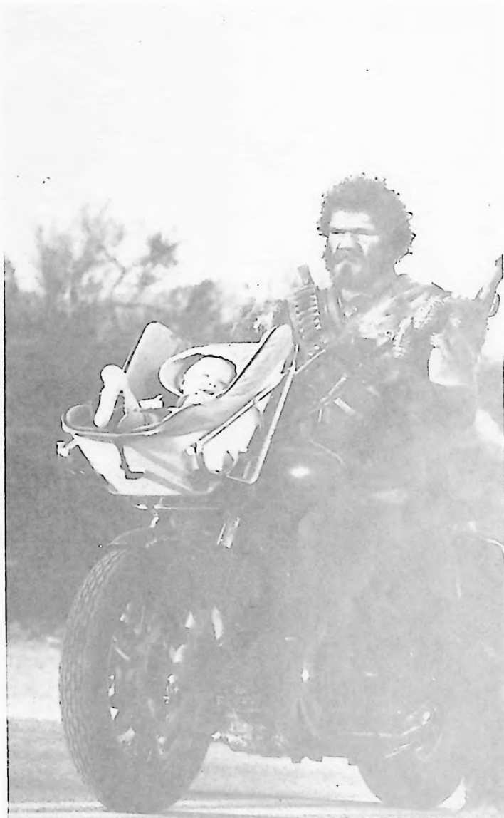
Educando a Arizona (Raising Arizona)

S u segundo film Educando a Arizona ( Raising Arizona ) se presentó en Nueva York y en el día del estreno estuvo precedido por un dibujo animado de Chuck Jones Duck amuck que un crítico creyó era parte del film. Es la historia de un matrimonio sin hijos Hi y Ed (Nicholas Cage y Holly Hunter) que al verse imposibilitados de tenerlos raptan a uno de los cinco del fabricante de muebles Nathan Arizona. El bebé Nathan junior es a su vez reclamado por un dúo facineroso recién evadido de la prisión: los hermanos Snoopes (John Goodman, Bill Forsythe) que quieren devolverlo al papá original. El bebé de marras sigue con el mismo destino del marido celoso en Sangre fácil como si fuera un objeto que pasa de mano en mano. Bajo una trama de aparente comicidad se encuentra una crítica punzante contra la forma con que se educa a la niñez en los Estados Unidos. Alguien observó que en ese país se otorga más relevancia al rapto de un bebé que a las muertes constantes y violentas que ocurren en Centro América. (Recordemos que se refería a la época álgida de la guerrilla). (6)