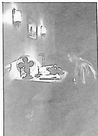
John Turturro en Barton Fink

A1 respecto dicen: "En Encuentro con la muerte un bosque de 1929 es similar como dos gotas de agua a un bosque de 1990". (22)