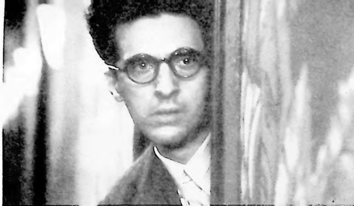
John Turturro en Barton Fink

experiencia" (27) , pero "la necesidad de contar historias no es siempre la misma cosa que el deseo de transmitir la verdad" (28)