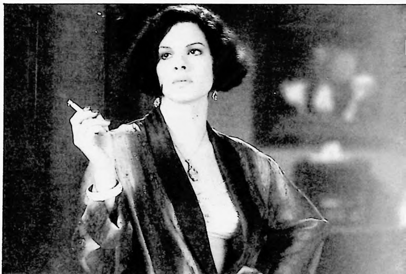
Marcia Gay Harden (Verna) mujer fatal en Encuentro con la muerte

La fotografía de Barry Sonnenfeld, en rojo (sangre), azul (noche) y marrones (vestimenta, objetos) sirve para cohesionar la estructura dramática. Como en Educando a Arizona , los Coen siguieron el objetivo Welles, de los grandes ángulos. En Encuentro con la muerte , según palabras de Sonnenfeld "la imagen no tiene profundidad pues queríamos hacer un film elegante utilizando enfoques alargados. Quisimos tratar de desintelectualizar el proceso del rodaje guardando la mayor irreverencia posible durante el rodaje. (17) El sitio que da lugar al título adquiere al final su verdadera dimensión