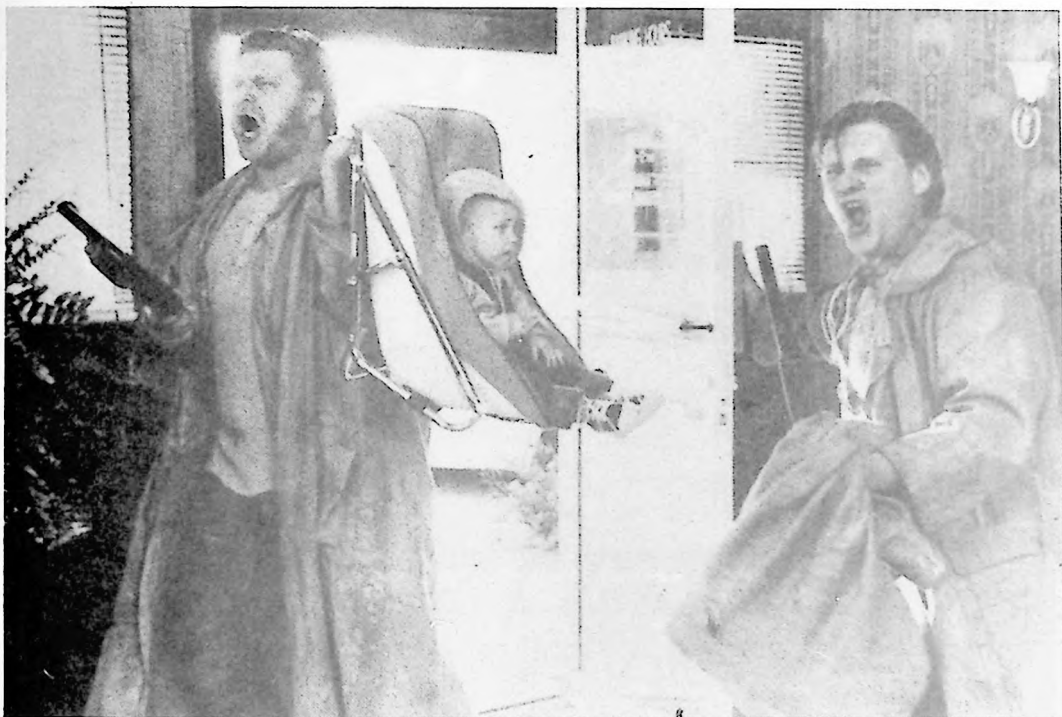
John Goodman y Bill Forsythe en Educando a Arizona

Ethan resumió la película como "Un Arizona del espíritu", un mundo poblado de bebés que crecen y se nutren en espacios de crueldad. Al final, como en la canción de Michael Jackson: Cura al mundo , los Coen proyectan un futuro luminoso, de armonía familiar dentro del espíritu poético y romántico de Wordsworth: "Si no es Arizona, que sea entonces