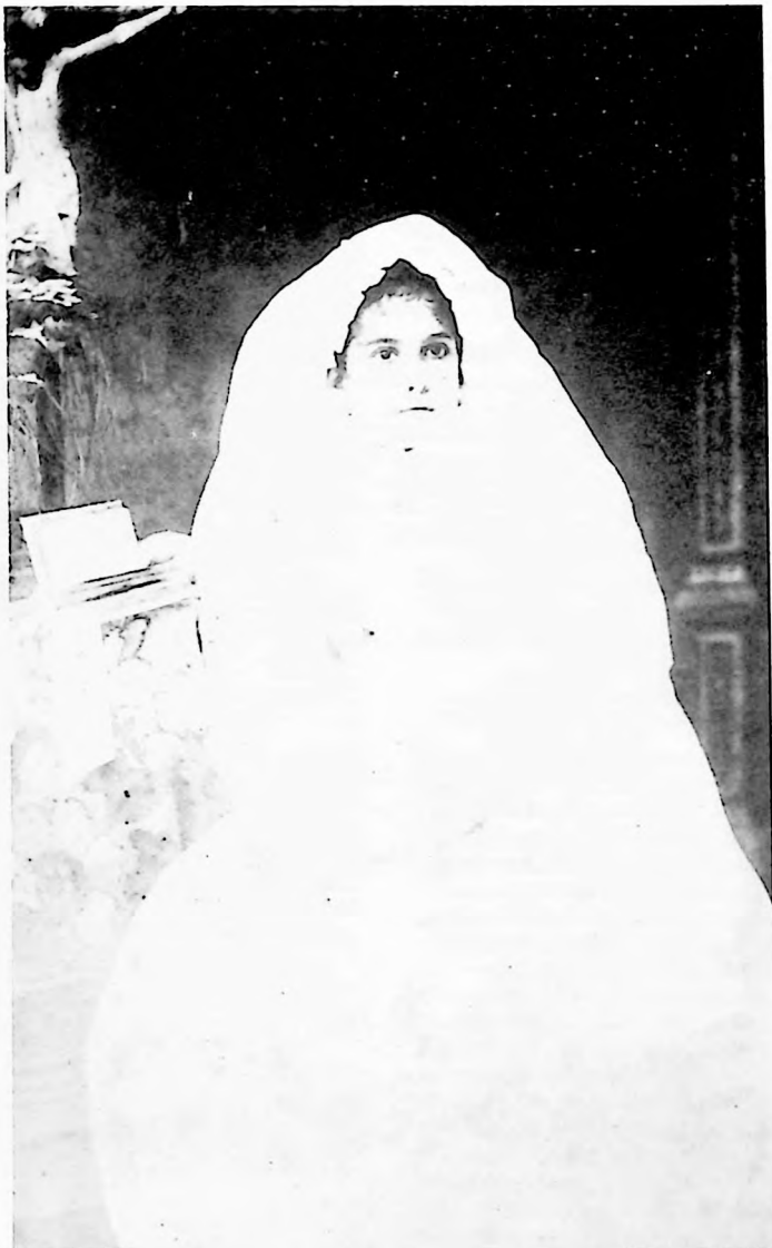
(3) Niña en traje de comunión C. 1878.