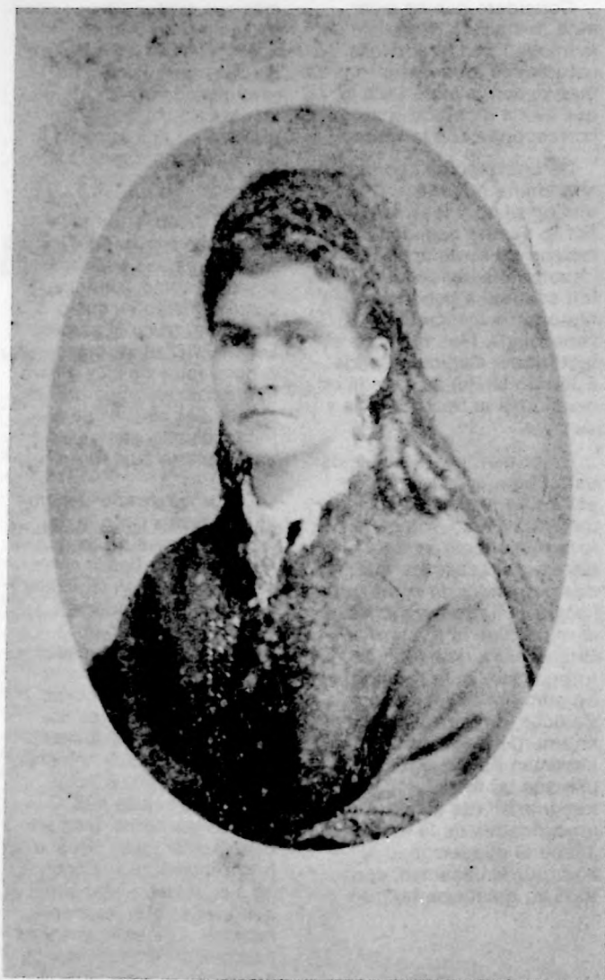
(1) Dama . C. 1866.