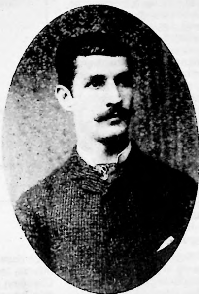
(9) Caballero de la ciudad C. 1874.

Salas, Martínez & C ía . Caracas. Plaza Bolívar.