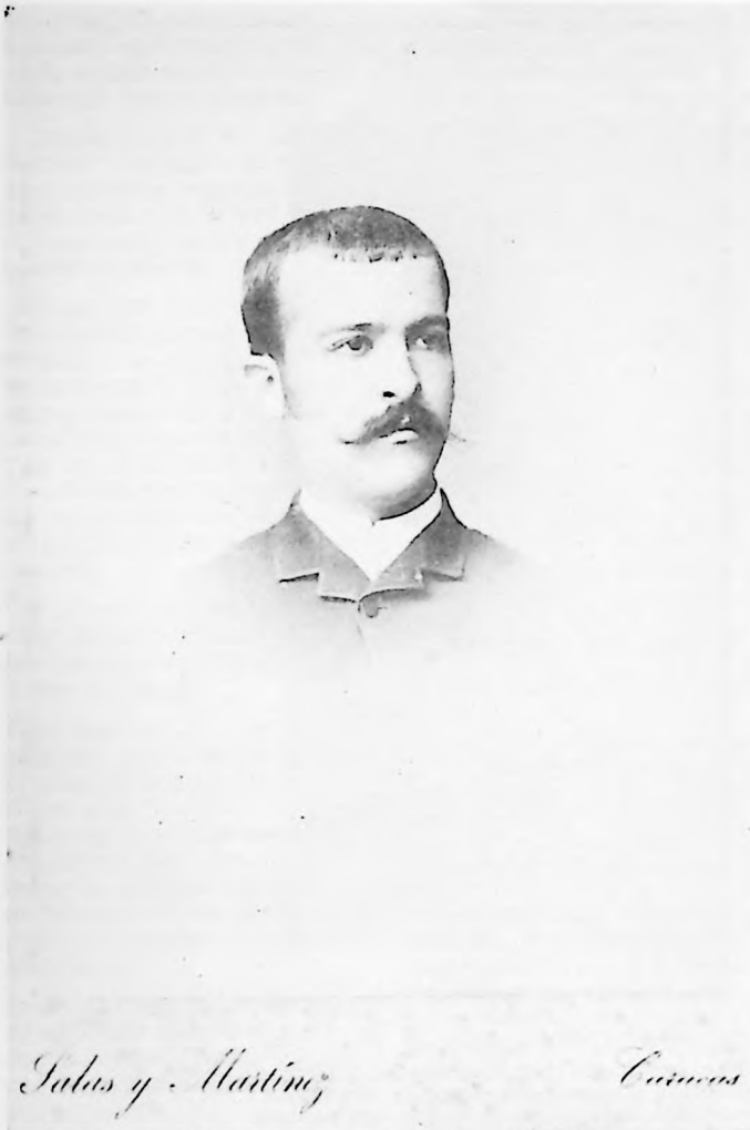
(5) Caballero con bigote C. 1871.

El 9 de Febrero de 1877 la Dirección Administrativa ordena de nuevo: