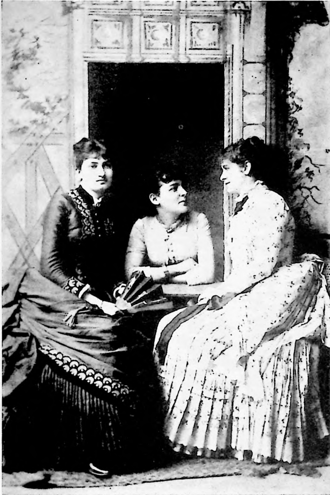
(6) Jóvenes damas de la sociedad caraqueña C. 1878.