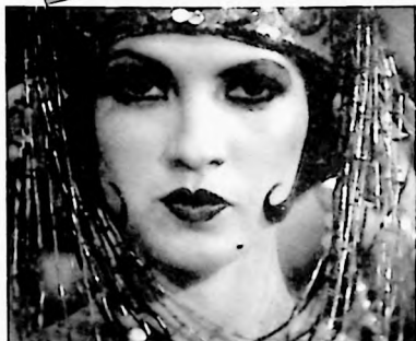
P.P. 04 2016