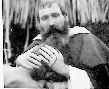
P.P. 04 2020