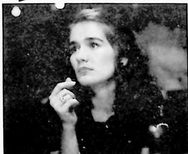
P.P. 04 2002