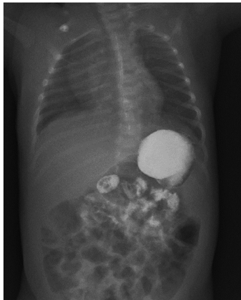
Figura 1: Vista anteroposterior de tránsito esofagogastroduodenal. Impresión cámara gástrica horizontalizada.