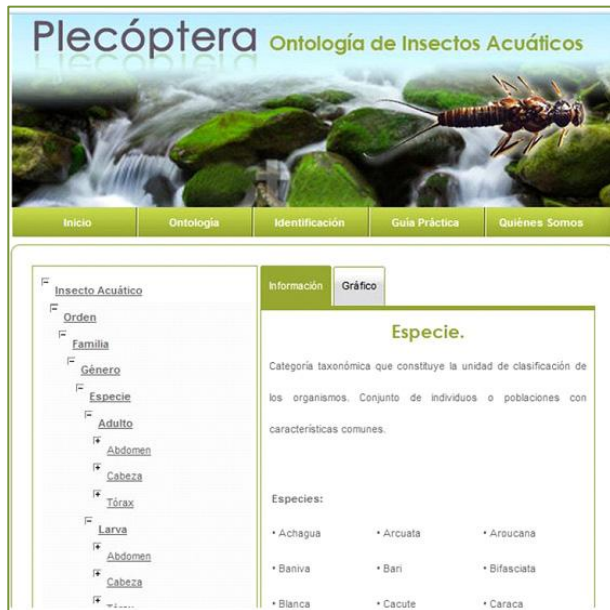
Figura 4. Pantalla de la aplicación Web que muestra la taxonomía de conceptos.