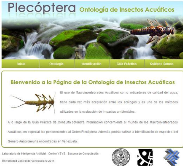
Figura 3. Página Principal de la Aplicación Web.