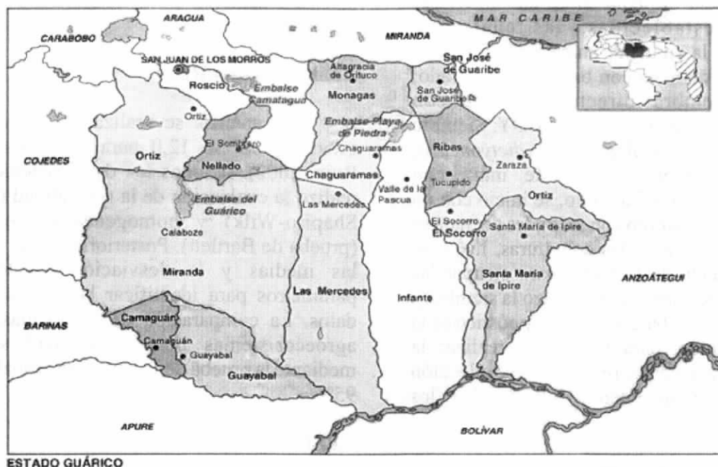
Figura 2. Localización de la Estación Experimental la Iguana (Imagen tomada de Hernández-Hernández y col, 2004.)

Bolívar. Nuestro trabajo se ha centrado en la Estación Experimental La Iguana, Municipio Santa María de Ipire, estado Guárico, Venezuela (8° 25' N y 65° 25' W) (Figura 2), con una altura entre 80-120 msnm, un clima estacional, con una época de sequía y otra de lluvia (3 a 6 meses húmedos), un relieve suavemente ondulado, con pendientes de 2 %, precipitación anual promedio de 1369 mm, y una temperatura media mensual de 27,3°C (Hernández y col., 2004a).