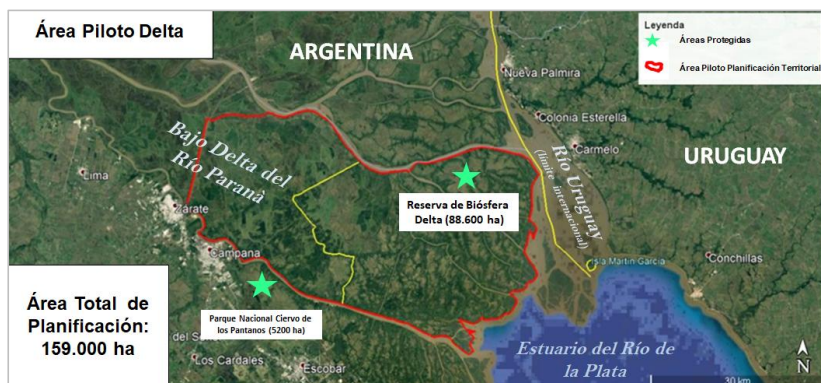
Figura 4. Bajo Delta - Área Piloto de Planificación Territorial y Áreas Protegidas.