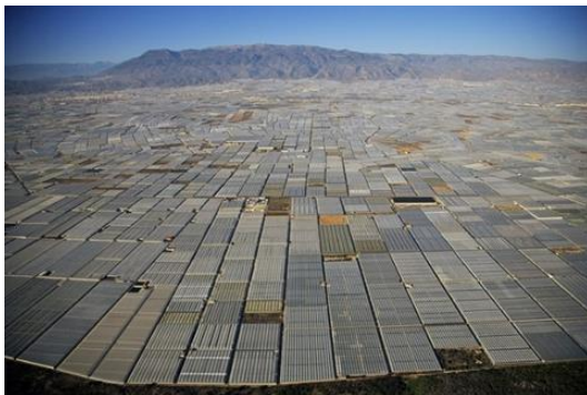
Figura 3. Foto aérea de área de producción agrícola con invernaderos en Almería, España.

con calefacción en invierno, ni el impacto en el paisaje que provocan. Algunas opiniones, más radicales, se oponen también al cultivo en invernadero por su “artificialidad”, que atribuye una disminución al contenido nutricional del producto ecológico final.