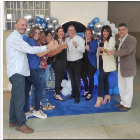
Miembros del Capítulo Carabobo y afiche de las jornadas