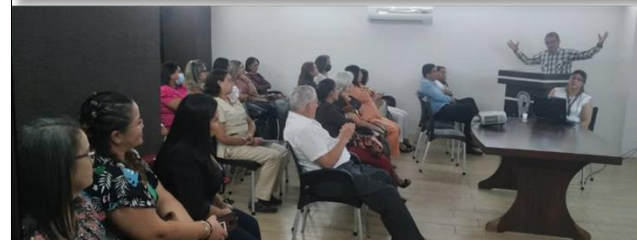
Miembros del Capítulo Falcón y Conferencistas invitados