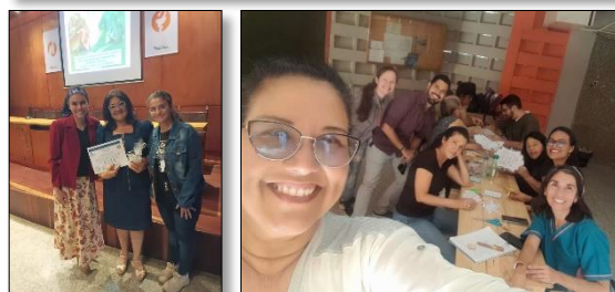
Miembros del Capítulo Mérida y Conferencistas invitados