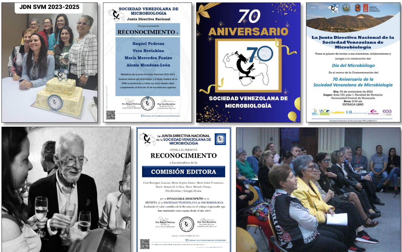
Miembros de la Junta Directiva Nacional, reconocimiento a la JDN saliente y a la Comisión Editora de la RSVM y afiche de las jornadas

Asistieron miembros de la SVM e invitados entre los que contamos a las autoridades de la UCV, de la Facultad de Farmacia, de la Facultad de Medicina (Escuelas: de Bioanálisis, Medicina, Enfermería) y SOS Telemedicina UCV. También estaban presentes el Comité Ejecutivo de la Federación de Colegios de Bioanalistas de Venezuela (FECOBIOVE). y las autoridades del Colegio de Bioanalistas DF y Miranda e invitados de la Sociedad de Infectología y del Taller VIH/SIDA.