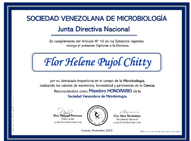
Diplomas de los miembros honorarios de la Sociedad Venezolana de Microbiología reconocidos en 2023.