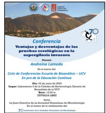
Afiches de las conferencias organizadas en el 2023 y los integrantes de la Junta Directiva Nacional la Sociedad Venezolana de Microbiología 2015-2023

El éxito del 2023 puede resumirse en la reactivación de la SVM, su JDN y poco a poco los Capítulos con nuevas juntas directivas, la organización de eventos de altísima calidad científica en conjunto con sociedades hermanas, con la mística y el amor al riguroso trabajo científico con el que nos formaron nuestros maestros la captación de nuevos miembros profesionales y estudiantes, incrementar la motivación de pertenecer a sociedades científicas, investigar, publicar y divulgar los conocimientos.