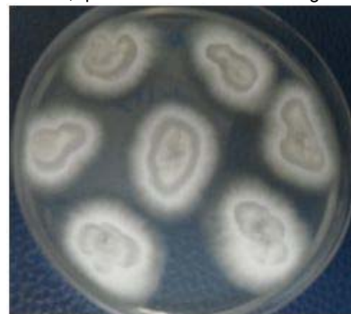
Figura 3. Crecimiento de las colonias color gris-blanco (anverso), al 5to. día de incubación a 25 °C en Sabouraud cloranfenicol.

Los tejidos fueron troceados en porciones pequeñas en cabina de flujo laminar clase II, e inoculados en Sabouraud Cloranfenicol agar y Micosel agar e incubados a 35 °C y 25 °C. A los 5 días el laboratorio de Micología reporta aislamiento de un hongo filamentoso de crecimiento rápido en ambas temperaturas y medios, con colonias de textura aterciopelada a algodonosa, de color blanco-crema a gris claro al inicio, de bordes irregulares y con un leve pigmento café en el reverso, que se torna más oscuro según envejece (Figura 3).