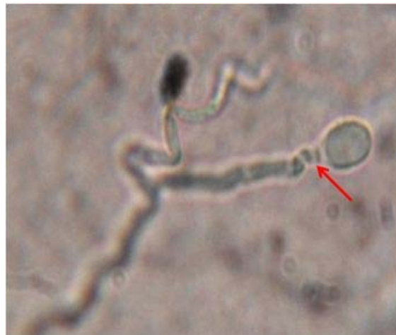
Figura 5: Microcultivos con azul de lactofenol, con aumento de 100 X, se observan las cicatrices en el conidióforo producto de la conidiogénesis anelídica.

100 X, resaltándose las cicatrices en forma de anillo que quedan en la pared externa del conidióforo cuando la conidia es empujada producto de la conidiogénesis anelídica (Figura 5). Los conidióforos son rectos con anelidación, pero no inflados en la base como ocurre en S. inflatum .