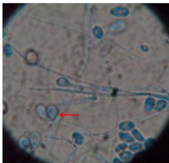
Figura 4. Microcultivo de 8 días de crecimiento en Agar Papa, con coloración de azul de lactofenol se observan los conidios ovales aislados o agrupados con bases truncadas (←), y conidióforos alargados no inflados. (100 X).

Al observar al microscopio una fracción de la colonia, teñida con azul de lactofenol, se observó la presencia de hifas hialinas septadas con conidióforos, de largo variable y anelloconidias unicelular oval y base trunca en su porción distal (Figura 4), que fue identificado como S. apiospermum