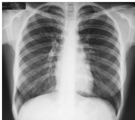
Figura 3. Radiografía de tórax PA normal. Sin evidencia de metástasis.

Se procedió a la extirpación quirúrgica de la totalidad de la zona debido a la alta sospecha de malignización y de que hubiese alguna lesión a cierta distancia producto del crecimiento rápido de la neoformación, se realizó resección quirúrgica con amplios márgenes que incluían los planos musculares superficiales y profundos, asimismo un segmento óseo de la 9 na costilla hasta abordar la cavidad torácica con inclusión de la pleura parietal. Se procedió a la reconstrucción del defecto de pared torácica con colocación de malla de monofilamento de polipropileno (Marlex ® ), y movilización de flap de musculo para un cierre completo de dicho defecto (Figura. 4). Se dejó una sonda torácica por contra apertura a través de toracostomia mínima a nivel del 5 to espacio intercostal línea axilar posterior para restitución de la presión de la cavidad pleural.