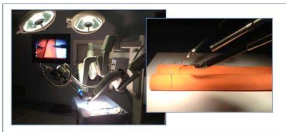
Figura 2: Tarea realizada por los participantes. (Sutura y anudado)

3-0, seguido por dos pases de sutura continua, para culminar con un anudado final. (Figura 2)