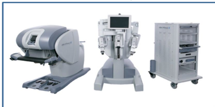
Figura N° 1: Componentes del Sistema Robótico Da Vinci®.

El Hospital Universitario de Caracas se ha convertido desde el 2009, con la adquisición de un sistema Da Vinci SHD® (Figura N° 1), en uno de los primeros centros de enseñanza a nivel Latinoamericano que ofrece a residentes en formación la oportunidad de entrenarse en cirugía robótica. En este sentido se nos plantea la necesidad de estudiar la realización de tareas complejas realizadas con robot en nuestro personal en formación, estableciendo de esta manera la primera experiencia nacional en esta materia, que servirá de punto de partida para una interesante línea de investigación, en la enseñanza de técnicas quirúrgicas mínimamente invasivas realizadas con asistencia de tecnología robótica.