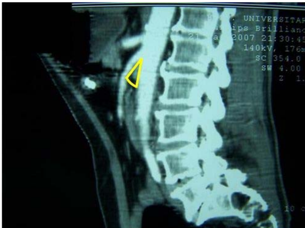
FIGURA N° 3. Tomografía Axial Computarizada. Reconstrucción Sagital. Se evidencia nacimiento en ángulo agudo de la Arteria Mesentérica Superior

se plantea el diagnóstico de Síndrome de la Arteria Mesentérica Superior (SAMS) por lo cual se realiza reconstrucción sagital, donde se evidencia nacimiento en ángulo agudo de la AMS; lo cual confirma el diagnóstico de SAMS. ( Figura N° 3 )