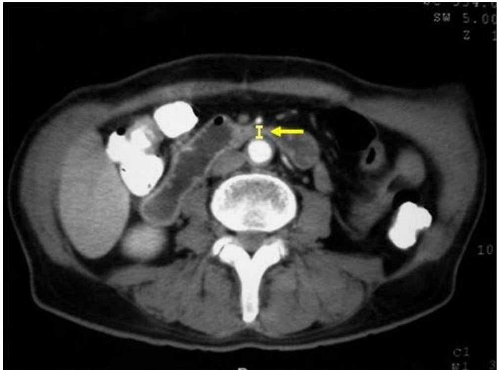
FIGURA N° 2. Tomografía Axial Computarizada. Las flechas amarillas indican la distancia Aorto – Mesentérica < 8mm

· Tomografía Axial Computarizada con doble contraste: Se observa obstrucción a nivel de la tercera porción del duodeno debido a compresión del mismo entre la Arteria Mesentérica Superior (AMS) y la Aorta ( Figura N° 2 );