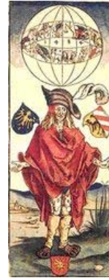
'La Sífilis' de Albrecht Dürero 1496