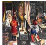
Cristóbal de Castillejo (1490-1550)

Nicolás Monardes (1493-1588), médico práctico de Sevilla, sin haber ido nunca a América, se dedicó a estudiar los productos medicinales, herbarios, que de ella provenían y los puso a prueba, creándose un 'cuerpo de doctrina' aceptable denominado ' Historia medicinal: de las cosas que se traen de nuestras Indias Occidentales, que sirven en medicina ' 1565-1574. (1)