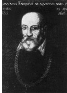
Fabrizio Di Aquapendente (1537-1611)