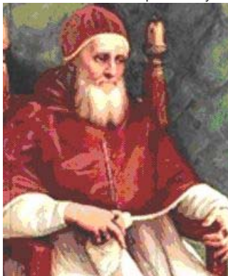
Papa Julio II (Giuliano della Rovere) 1443-1513

Giovanni da Vigo (1450-1525) de la zona de la Liguria italiana, se ganó la confianza y los favores del cardenal Giuliano della Rovere, futuro Papa Julio II (1443-1513), llamado el 'Papa Guerrero' el año 1503, famoso por sus disputas con el gran artista renacentista Michelangelo por los trabajos de la Capilla Sixtina, tenía tres hijos y había adquirido el "mal francés". Decía Vigo en su libro publicado en 1514 " De practica copiosa in arte chirurgica " que el "mal francés o morbus gallicus" tenía origen sin excepción " In vulva in mulieribus et in virga in hominibus " ("En la vulva en las mujeres y en el pene en los hombres), después del coito infectante. Habló de lesiones primarias (genitales), lesiones secundarias (pústulas cutáneas) y lesiones terciarias (gomas luéticas, " tuberosidades llenas de materia gruesa y flemática "). Por dichas lesiones el Papa Julio II, prohibía a los fieles que le besaran los pies, práctica muy común para la época, ya que tenía una " podagra tuberosa e ulcerata " que Vigo curaba diariamente con un " emplastrum de Vigo cum mercurio " contra pústulas y exantemas (1),(7),(9)