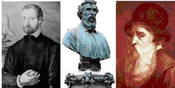
Benvenuto Cellini (1500-1571)

El gran artista florentino Benvenuto Cellini (1500-1571) escultor, grabador, y escritor, se convirtió en uno de los orfebres más importantes del Renacimiento italiano y realizó monedas labradas, joyas, floreros y adornos exquisitos. Fué un hombre mundano con devaneos sexuales que anecdóticamente ocasionaban su encarcelamiento con cierta frecuencia, siendo ayudado constantemente por sus mecenas, la familia Médicis, a la sazón, la familia más poderosa y rica de la ciudad. En uno de los escritos biográficos se mencionaba: 'curado por el palo santo, recayó un día de caza a consecuencia de la lluvia y del viento que hubo de soportar, restableciéndose de nuevo gracias al bendito remedio americano, dos veces usado contra el parecer de los mas famosos médicos de Roma' (1)