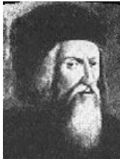
Jacopo Berengario da Carpi (1460-1530)

Jacopo Berengario da Carpi (1460-1530), autor del libro " De arte mingendi cum instrumentis ", fué factor importante en la instauración de la terapia mercurial para los pacientes aquejados del mal francés-sífilis, a partir del año 1494, dándole notoriedad.