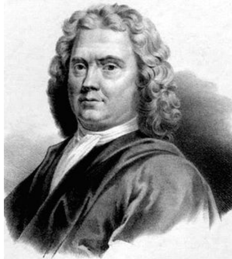
Hermann Boerhaave (1668-1738)