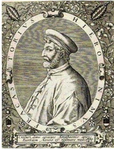
Gerónimo Fracastoro (1478-1553)

Lues, sinónimo de sífilis, significa epidemia en latín. Se le denominaba también como lues venéreo por los franceses, 'epidemia del placer', 'mal francés', 'mal italiano' o 'mal napolitano', 'mal español', 'mal de Búas' o Bubas, 'sarampión de las Indias', y 'pudendagra' por los latinos, entre muchos de los sinónimos utilizados en los siglos XV y XVI. La palabra gonorrea proviene de flujo seminal ' gono rhein ' y blenorragia significa literalmente ' flujo mucoso '. El término venérea, procede de Venus, diosa romana de la belleza, del amor y de la fecundidad, versión latina de la diosa griega del amor, llamada Afrodita. Conjuga lo amoroso y lo femenino. Son enfermedades que necesitan del contacto íntimo-sexual para su contagio y propagación (3)