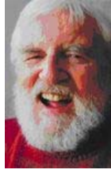
Alfred W. Crosby

El historiador Alfred W. Crosby historiador y profesor norteamericano de fama mundial, sugiere en su libro 'The Columbian Exchange' (1972),(22) que las dos teorías (precolombina y colombina) podrían ser correctas y a través de su teoría denominada la guiñada o frambesía tropical, expone la corriente dual de la explicación del origen de la sífilis.