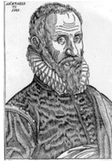
Ambrosio Paré (1510-1590)