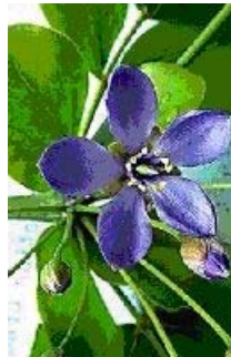
Guayacán o Palo Santo de las Indias

El primer caso de sífilis curado por el guayacán lo relata Nicolás Monardes, cito textualmente: 'Dio noticias dél a su amo de este manera. Como un español padeciese grandes dolores de bubas, que una india se las había pegado, el indio le dio el agua del guayacán, con que no sólo se le quitaron los dolores que padecía, pero sanó muy bien del mal; (...) y cierto para este mal es el mejor y más alto remedio de cuantos hoy ser han hallado y que con más certinidad y más firmeza sana y cura la tal enfermedad. Porque si se da esta agua como se ha de dar, es cierto que sanan perfectísimamente, sin tornar a recaer, salvo si el enfermo no torna a revolcarse en el mismo cieno do tomó las primeras'