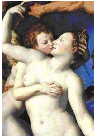
Pintura 'Alegoría de Venus'. Agnolo Bronzino 1545

Lues, sinónimo de sífilis, significa epidemia en latín. Se le denominaba también como lues venéreo por los franceses, 'epidemia del placer', 'mal francés', 'mal italiano' o 'mal napolitano', 'mal español', 'mal de Búas' o Bubas, 'sarampión de las Indias', y 'pudendagra' por los latinos, entre muchos de los sinónimos utilizados en los siglos XV y XVI. La palabra gonorrea proviene de flujo seminal ' gono rhein ' y blenorragia significa literalmente ' flujo mucoso '. El término venérea, procede de Venus, diosa romana de la belleza, del amor y de la fecundidad, versión latina de la diosa griega del amor, llamada Afrodita. Conjuga lo amoroso y lo femenino. Son enfermedades que necesitan del contacto íntimo-sexual para su contagio y propagación (3)