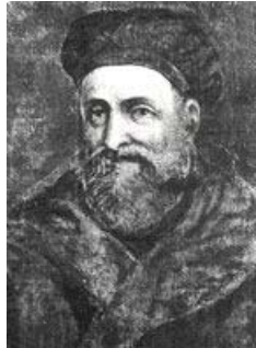
Gabriele Falloppio (1523-1562)

Gabriele Falloppio (1523-1562) cirujano y anatomista italiano, en su libro " De preservatione a carie gallica " del año 1555 ideó una protección individual para el llamado "mal francés o sífilis" consistente en un corte de lino en forma de saco, a la medida del glande " ad mensuram glandis " empapado de mercurio, antecesor del moderno preservativo (1).