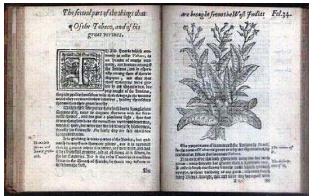
Libro de Monardes con el guayacán

La madera del Guaiacum officinale y del Guaiacum sanctum , árboles de pequeño crecimiento, tiene en su corazón, el Lignum vitae del cual se saca el guayacán. En latín se denomina "Madera de vida" por sus usos medicinales. Otros nombres son palo santo, madera santa, corazón verde y madera de hierro (53)