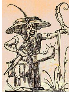
Caricatura del Papa Alejandro VI como sifilítico

El papa Alejandro VI (Rodrigo Borja o Borgia en su forma italianizada) con su proceder indigno de su investidura, fue uno de los objetivos principales de la reforma protestante en escritos, panfletos y grabados y era caricaturizado como sifilítico. (1)