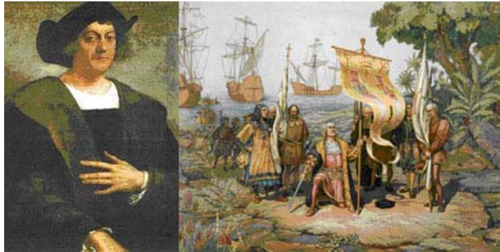
Cristobal Colón (1451-1506) y el descubrimiento del Nuevo Mundo

El descubrimiento de América realizado por Cristóbal Colón en 1492 originaría una de las polémicas más intensas de la historia de la medicina como fué el origen de la sífilis (1),(2),(10), (11),(12),(13).