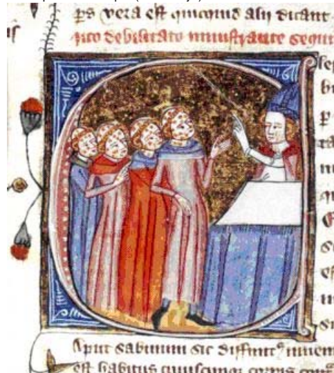
Monjes infectados de enfermedad exantemática (sífilis?) bendecidos por sacerdote. Ilustración de letra C capital del manuscrito inglés siglo XIII 'Omne Bonum' James le Palmer Teoría Colombina

En ésta teoría, a Cristóbal Colón se le responsabiliza como el factor de traslado de la sífilis del continente americano a Europa, desde La Española (Haití) y con ello de la pandemia del siglo XV en territorio europeo a la cual se le dieron las más disímiles explicaciones, entre otras responsabilizando a los judíos, responsabilizando a la pobreza espiritual del vulgo y del clero por el pecado existente en el mundo y también por las blasfemias que se proferían, no faltando las personas que creían en que dichas pandemia era un preámbulo al momento del apocalipsis. Se ha demostrado que existían esqueletos de nativos americanos precolombinos con lesiones sifilíticas cuando arribó a América la tripulación del primer viaje de Colón el año de 1492 (21)