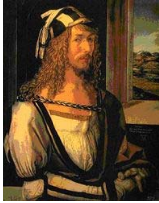
Albrecht Dürero (1471-1528)

El grabado del pintor Albrecht Dürero (1471-1528), en su parte superior se muestra una esfera con los signos del Zodíaco. Junto a Escorpio se ven varias estrellas y una, al lado de Tauro, significando que se establecía una conexión entre las constelaciones y el mal venéreo. La fecha 1484 dentro de la esfera no indicaba el año de impresión, sino la conjunción astral en el día de santa Catalina en 1484, signo del comienzo de la "peste genital", según la interpretación de los médicos y astromatemáticos de la época. (1)