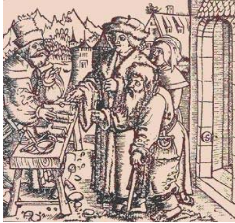
Grabado en madera de la venta del Palo de Guayacán

las islas de las Indias occidentales, en el sur del estado de Florida en Estados Unidos de Norteamérica y en el norte de sudamérica (31),(32).