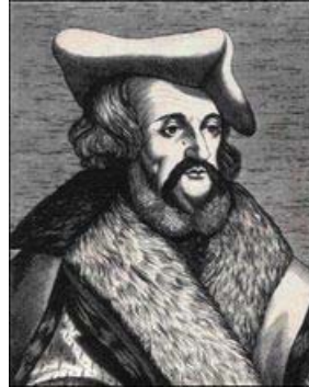
Gerónimo Fracastoro (1478-1553)