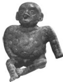
Escultura precolombina de un niño con probables manifestaciones luéticas

En los primeros años del siglo XVI se escribía en Europa que la causa por la cual el guayaco o palo santo, importado de américa, curaba la sífilis era simplemente porque provenía del continente responsable de su propagación, es decir, de 'el remedio proviene de donde proviene la enfermedad'. Diaz de Ysla y Hernandez de Oviedo entre otros, apoyaron la teoría colombina.