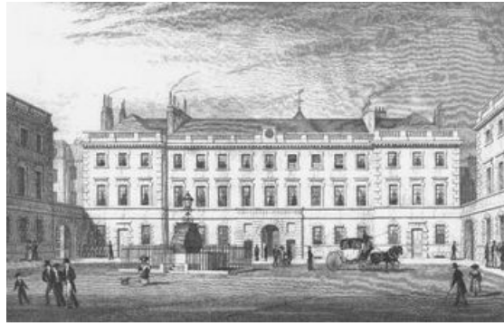
Hospital San Bartolomé de Londres. Grabado siglo XIX

El "Tratado de Urología" del Francisco Díaz (1527-1590), Padre de la Urología española y cirujano del rey Felipe II, menciona en el último de los libros el tratamiento de las almorranas, de la flema salada, y la ' ninpha o crecimiento de carne en el pudendo de la mujer' posiblemente refiriéndose a las verrugas virales genitales actualmente denominadas virus del papiloma humano. El ' cisorio ' instrumento precursor del moderno uretrotomo era similar a un catéter dentro del cual se introducía una ' verga fina de plata ' con el que se iba cortando la carnosidad uretral (estrecheces o endurecimientos de la uretra), que él decía eran casi siempre ocasionados por la gonorrea o mal francés. Analiza en sus obras los procesos inflamatorios uretrales usualmente secundarios a enfermedades venéreas (1)