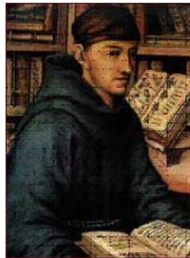
Bernardino de Sahagún (1499-1590)

Bernardino de Sahagún, escritor y fraile franciscano, nombre adoptado por Bernardino de Rivera, (1499-1590) autor de numerosas obras en náhuatl y español, consideradas hoy entre los documentos más valiosos para la reconstrucción de la historia de México y de los aztecas, antes de la llegada de los conquistadores españoles. Refuerza la tesis de la antigüedad de ésta enfermedad originándose en América, por relacionarla con la apoteosis de Teotihuacán, cerca de Otumba, donde reunidos los dioses 'antes que uviese día en el mundo se arrojó a una hoguera el dios Nanaoatzin que estaba plagado y despues de volar, hecho ceniza, al cielo, salió convertido en sol' (1)