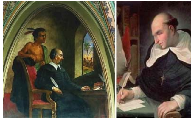
Fray Bartolomé de las Casas (1484-1566)