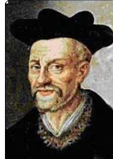
Ulrich von Hutten (1488-1523) Francois Rabelais (1484-1553)

Pier Andrea Mattioli (1500-1577), médico nacido en la ciudad toscana de Siena, describió magistralmente dos productos para combatir el 'mal de Bubas': el 'guayaco' y la 'zarzaparrilla'.