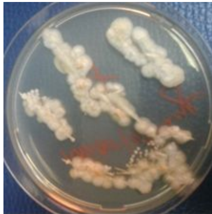
Figura No 2: crecimiento de Saprochaete capitata al 4to día. Cultivo puro sobre cada tejido inoculado en Sabouraud cloranfenicol a 35 °C.

Se solicitó interconsulta al servicio de Infectología, los cuales inician tratamiento con anfotericina B y Voriconazol.