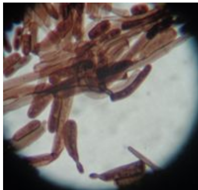
Figura No. 5: coloración de Grocott: hifas, annelloconidias y atroconidios con bordes curvados, de Saprochaete capitata . 100X.

Figura N° 4: Preparación en azul de lactofenol a partir del cultivo de 7 días de incubación, donde se observan hifas curvadas y conidias típicas de Saprochaete capitata . 40X