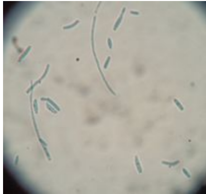
Figura N° 4: Preparación en azul de lactofenol a partir del cultivo de 7 días de incubación, donde se observan hifas curvadas y conidias típicas de Saprochaete capitata . 40X

Figura No. 3: subcultivo en agar papa, nótese los bordes irregulares de las colonias.