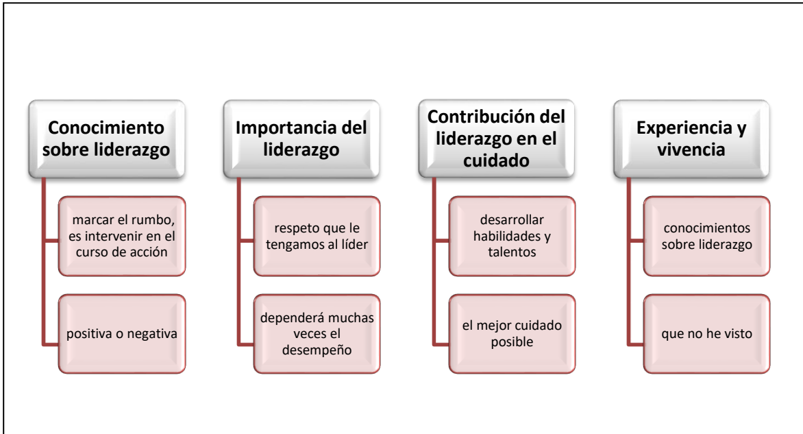
Gráfico 2: Estructura informante Rosa Fuente Berrios 2018