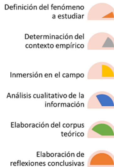
Figura 1: Etapas del Método de Trabajo Desarrollado en la Investigación

La investigación desarrollada se centró en la comprensión e interpretación de los significados que para los actores involucrados en ésta tiene la implementación de la modalidad de educación semipresencial mediada por las TICs, en los programas nacionales de formación gestionados por tres instituciones de educación universitaria. La interpretación se llevó a cabo mediante la interacción dialéctica entre los informantes y la investigadora. El método de trabajo desarrollado para realizar esta investigación estuvo enfocado en la ejecución de varias etapas, tal como se muestra en la Figura 1.