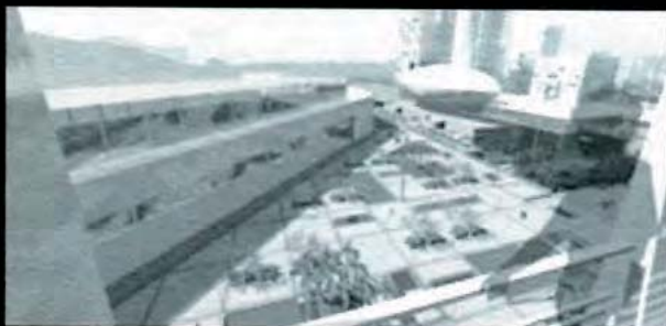
Arq. Franco Micucci y Asociados / Caracas-Venezuela