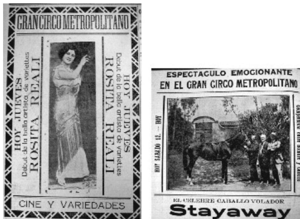
Figura 9. El Nuevo Diario . Caracas, 27 de agosto y 12 de septiembre de 1914, p. 8

que la CGC distribuye. La firma instala una oficina en el boulevard este del Capitolio y comienza a anunciarse como distribuidora de películas (Fig. 12).