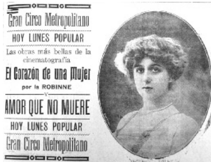
Figura 11. El Nuevo Diario . Caracas, 17 de agosto de 1914, p. 7

para sus salas 37 y que la serie de filmes Pathé protagonizados por Robinne sólo han sido estrenados por la sociedad Ideal Cine-Cinema Gaumont Palace que no se cuenta entre su clientela, parece claro que Union Graph está siendo atendido por otra distribuidora, además de la CGC. Si esta última cubre los títulos proyectados en el Metropolitano los martes, jueves y fines de semana, ¿quién suministra la programación los lunes, miércoles y viernes? Es Ideal Cine, nada menos, cuya labor como distribuidora comienza a ser cada vez más intensa (Fig. 13). Los cambios siguen, cada vez más