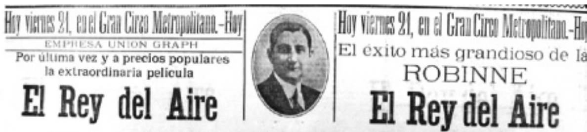
Figura 7. El Nuevo Diario . Caracas, 21 de agosto de 1914, p. 6

Para septiembre es evidente que la Compañía General Cinematográfica aporta buena parte de los filmes que exhibe Unión Graph en el Metropolitano, pues los avisos precisan que las funciones de los martes, jueves, sábados y domingos provienen del repertorio de la CGC. Pero esto no abarca a todos los títulos que el local proyecta. Ni tampoco es el Metropolitano el único local al