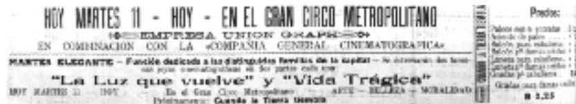
Figura 10. El Nuevo Diario . Caracas, 11 de agosto de 1914, p. 6