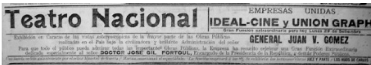
Figura 5. El Universal . Caracas, 26 de septiembre de 1913, p. 3

Tras la brevísima temporada de Los últimos días de Pompeya , Empresas Unidas proyecta un par de películas más aplicando la misma línea promocional de las “superproducciones”. Se trata de filmes italianos y franceses, contratados a la distribuidora colombiana Di Doménico Hermanos, cuyos representantes se encuentran entonces en Caracas: Roger la Honte (Adrien Caillard, Pathé Frères, 1913) estrena el 28 de febrero y Quo vadis? (Enrico Guazzoni, Società Italiana Cines, 1913) el 6 de marzo. Siendo los estrenos en el Teatro Nacional y no ya en el Municipal, las tarifas descienden un poco: “Palcos con seis asientos B 12; Sofá numerado B 2; Patio numerado B 0,50; Galería B 0,50”. En abril, las Empresas Unidas siguen exhibiendo programas compartidos, aunque la promoción decae de forma importante. Es el preludio de su separación: a partir de mayo, el nombre de Unión Graph sólo encabeza la cartelera del Metropolitano, mientras Ideal Cine identifica al Teatro Nacional. El último estreno conjunto será otro título de Di Doménico Hermanos, Blanco y negro (Ubaldo dell Colle,