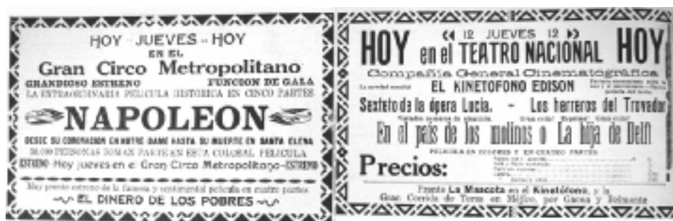
Figura 14. El Nuevo Diario . Caracas, 12 de noviembre de 1914, p. 8