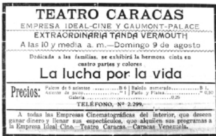
Figura 13. El Nuevo Diario . Caracas, 8 de agosto de 1914, p. 2