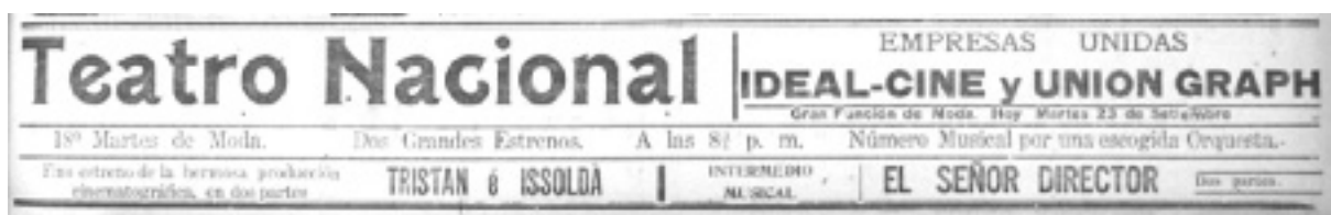
Figura 3. El Universal . Caracas, 23 de septiembre de 1913, p. 3

El convenio Ideal-Unión, sean cuales sean sus bases 23 , sólo abarca la programación de las dos salas caraqueñas referidas. Cuando vuelve a Caracas, Ideal Cine