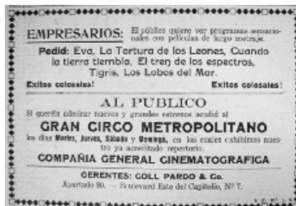
Figura 12. El Nuevo Diario . Caracas, 12 de septiembre de 1914, p. 2

Señores miembros de la Junta Directiva de la Compañía Anónima Cinematográfica y de Espectáculos.- Presentes.