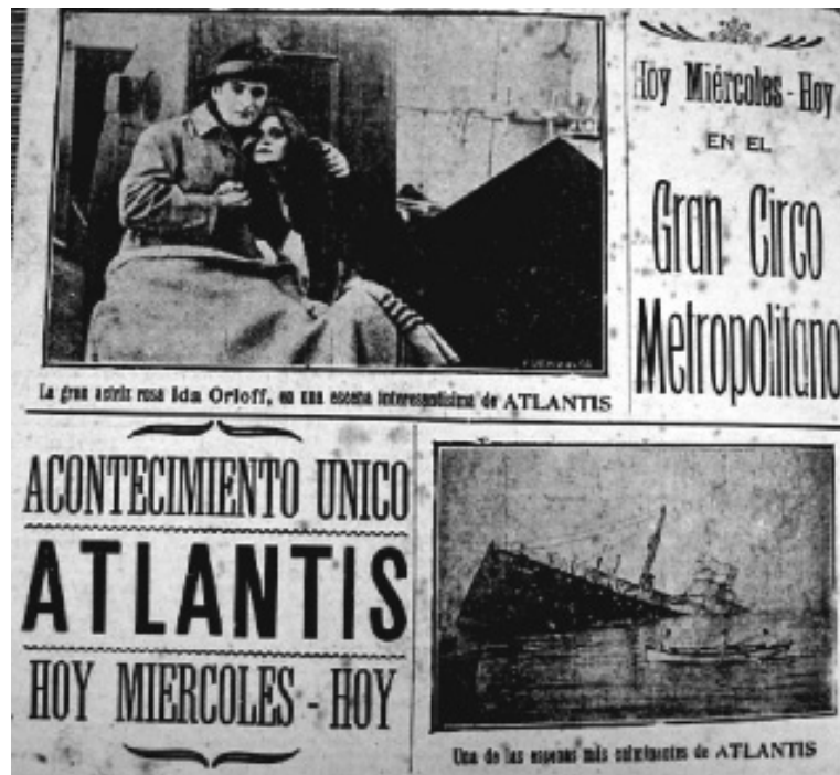
Figura 8. El Nuevo Diario . Caracas, 30 de septiembre de 1914, p. 8