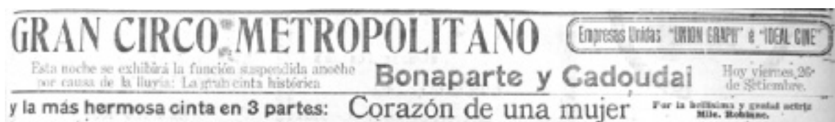
Figura 4. El Universal . Caracas, 26 de septiembre de 1913, p. 3