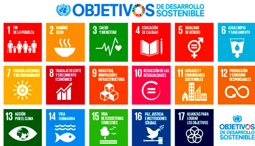
Fig.2. Los 17 Objetivos de Desarrollo Sostenible.

Desarrollar infraestructuras fiables, sostenibles, resilientes y de calidad, incluidas infraestructuras regionales y transfronterizas, para apoyar el desarrollo económico y el bienestar humano, haciendo especial hincapié en el acceso asequible y equitativo para todos.