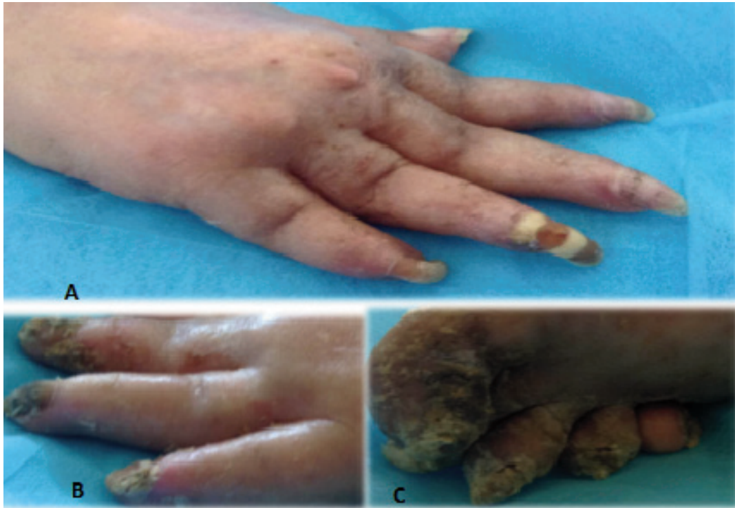
Imágenes obtenidas bajo consentimiento informado de paciente hospitalizado en Módulo A. Mayo - Junio 2015