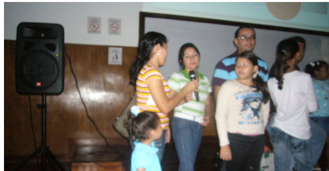
Las madres se expresan sobre Servicio Comunitario en la UCV

Los estudiantes universitarios nos ayudan a superar las dificultades de aprendizaje de las áreas de Matemáticas y Lenguaje. A pensar y reflexionar para tener una buena convivencia. Cuando hay algún conflicto siempre dialogamos y nos damos la paz.