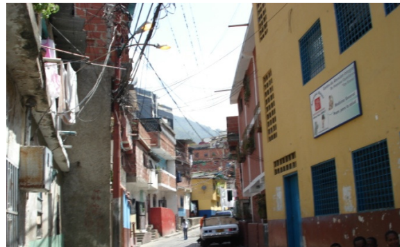
Espacio de uso comunitario: Ambulatorio, Capilla católica, Salón de usos múltiples

Desde antes de 1960, la Institución Teresiana ha colaborado en el barrio con el propósito de mejorar las condiciones de vida de la comunidad. Primero lo hizo a través de una Junta integrada por Representantes de alumnas del Colegio Santa Teresa y miembros de la Institución Teresiana, que contribuyó a cubrir las aguas negras, asfaltar veredas (aceras) y escaleras, y construir la Escuela del Barrio y la Capilla. Con el transcurso del tiempo, también se atendió un dispensario médico, se hicieron acciones de alfabetización, labores de manualidades, mecanografía, corte y confección.