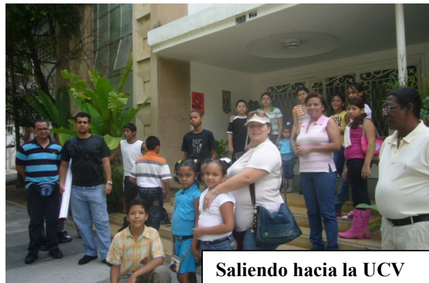
Saliendo hacia la UCV

El Proyecto Victoria Díez nos proporciona una educación integral, quiere decir que nos forma en todo, que nos ayuda a mejorar en los estudios y a relacionarnos mejor con los compañeros, en la calle y con nuestras familias.