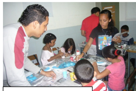
Taller de recreación