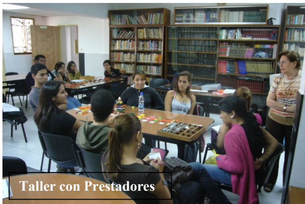
Taller con Prestadores

El universitario, genera impacto positivo para la calidad educativa, y en definitiva en la calidad de la vida de las comunidades donde se implica. El universitario genera valores, sólo su presencia implica algo, es valor.