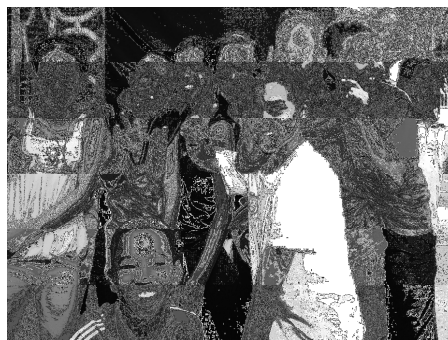
Actividad en Biblioteca abierta