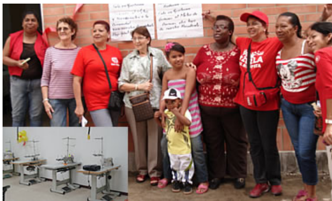
Habitantes del Barrio

El Proyecto es posible gracias a la colaboración de personas de la comunidad y al apoyo de entidades, como la Institución Teresiana, que cedió el espacio físico para el emprendimiento; la empresa Metro de Caracas que aportó los fondos necesarios para el acondicionamiento del espacio