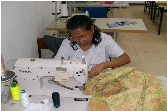
Vista parcial del Taller