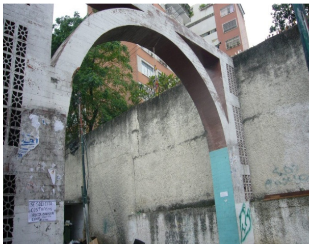
Entrada al Barrio los Erazo

Estos tiempos nos llaman a recrear la educación, a inventar nuevas soluciones y nuevas respuestas a los desafíos que estamos viviendo, en una perspectiva humanizadora y transformadora, que cree que es posible construir otro modelo de sociedad más humano e igualitario. Tiempos en que estamos siendo desafiados a reinventar la educación, a reinventar la educación, el desarrollo de nuestras comunidades.