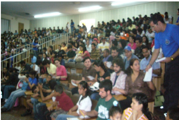
Proyecto Victoria Díez en UCV con Servicio Comunitario

Las psicólogas nos orientan en nuestro crecimiento personal, y nos ayudan a controlar nuestras emociones para resolver problemas de buenas formas.