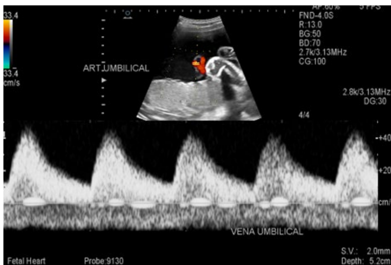
Figura 1. Técnica de realización para la evaluación de la arteria umbilical, porción de asa libre

Desde el punto de vista técnico, para la evaluación doppler de las arterias umbilical y cerebral media se siguieron las recomendaciones establecidos por la International Society of Ultrasound in Obstetrics & Gynecology (ISUOG) (3). Para la evaluación de la arteria umbilical se realizó la medición en la porción del asa libre (figura 1). Para el estudio de la arteria cerebral media se realizó un corte a nivel de la calota fetal en el plano axial donde se incluyó el tálamo y las alas mayores del hueso esfenoides, el volumen de muestra se colocó en el tercio proximal de la arteria cerebral media cerca de su origen en la arteria carótida interna (figura 2). En la evaluación de ambas arterias se registraron de 3 a 5 ondas de forma similar y se realizó el cálculo.