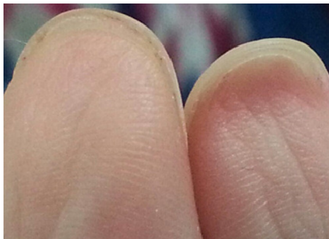
Figura 2. FPterigión ungueal ventral en ambos pulgares. Nótese la extensión del hiponiquio hacia la cara ventral de la lámina ungueal.