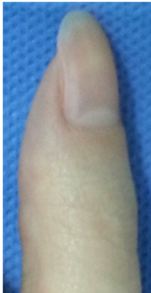
Figura 3. Cara dorsal de pulgar afectado, no ha afectación de tejidos periungueales.