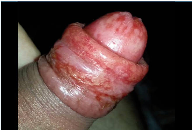
Figura 1.- Dermatitis por contacto irritativa severa sobre glándulas de Fordyce. Cuerpo de pene, prepucio y glande.

Paciente masculino de 28 años de edad, sin antecedentes personales ni familiares de interés. Refiere aparición de lesiones en cuerpo de pene de 2 años de evolución, con sensación de dispareunia y ardor en las relaciones sexuales. Evaluado por otros especialistas no dermatólogos indicándole diferentes tratamientos como antimicóticos orales y tópicos, aciclovir oral y tópico, antibióticos orales y tópicos presentando cuadros de irritación severa que ameritaron utilización de esteroides orales y tópicos (Figura 1).