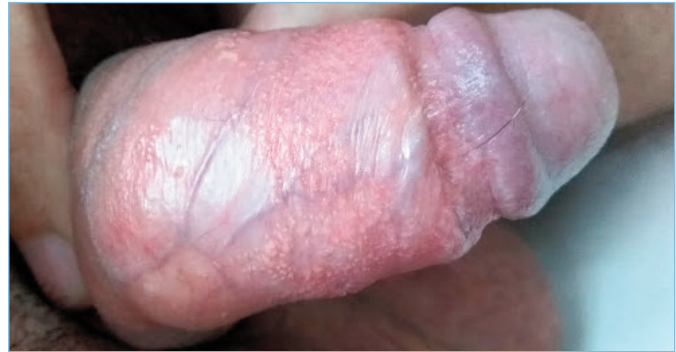
Figura 2.- Placa extensa conformada por micropápulas amarillo parduzcas de 3 mm de diámetro, superficie lisa y tendencia a confluir. Cara dorsal del cuerpo del pene.

Fue evaluado posterior al cuadro agudo, se observó placa de aproximadamente 8x8 cm de diámetro en cara ventral de cuerpo de pene constituida por micropápulas confluentes amarillentas con prepucio redundante. (Figura 2) Perfil general de laboratorio que incluyó VDRL y VIH estaban normales y/o negativos.