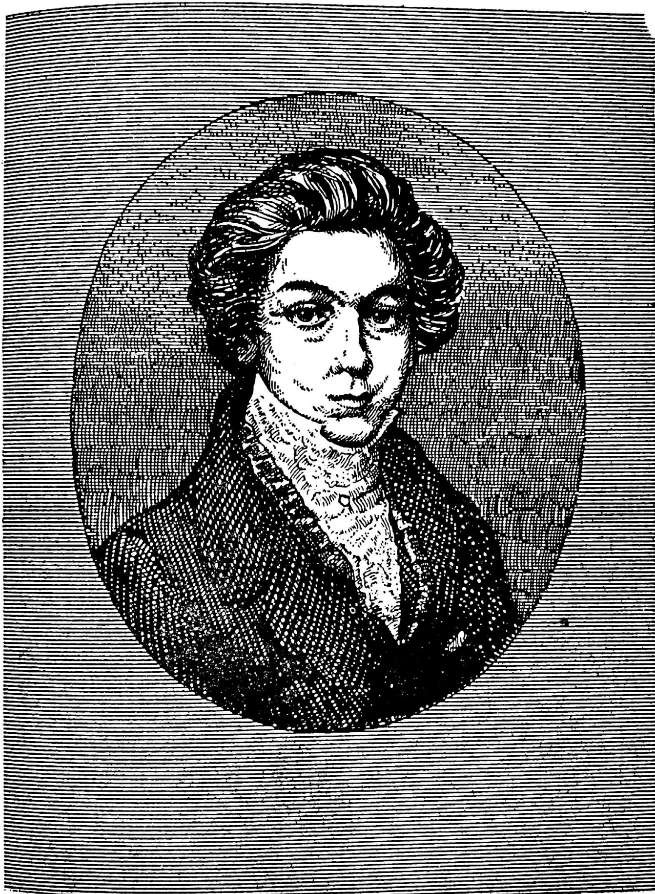
SIMON BOLIVAR EN 1802

(Miniatura hecha en Madrid. Pertenece el original al Conde de Los Villares).