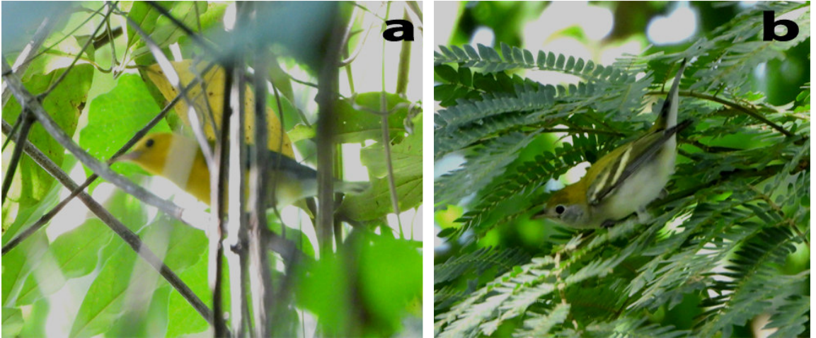
Figura 2. (a) Individuo macho adulto de Reinita protonotaria Protonotaria citrea . (b) Individuo macho juvenil de Reinita de lados castaños Setophaga pensylvanica . Observados el 16 de octubre de 2023 en una zona urbana de San Cristóbal, estado Táchira, Venezuela.

Un individuo solitario fue observado el 15 de octubre a las 09:02 h, posado y alimentándose de los frutos de un árbol de Ficus sp., cerca de la Quebrada La Potrera (7°48'19.28"N, 72°11'57.62"O), donde fue fotografiado por primera vez. Posteriormente, el 16 de octubre a las 10:00 h se sumaron más observadores, cuando se pudo obtener más evidencia fotográfica, además se aplicó playback con el reclamo de diversas especies del género Myiodynastes , el individuo solo se acercó con el reclamo de M. luteiventris , pero no vocalizó (Contreras et al. 2023). Así mismo, todas las marcas de campo que se muestran en las fotografías (Figura 3), indican que se trataba de un Myiodynastes luteiventris , el color y forma del pico, la extensión de mancha gular y el patrón de las estrías en el vientre no se corresponden con alguna de las subespecies en el complejo maculatus que pudieran tener similitud.