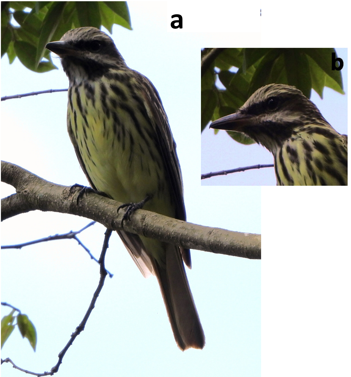
Figura 3. Individuo adulto de Gran atrapamoscas cejiblanco Myodynastes luteiventris observado el 15 y 16 de octubre de 2023 cerca de la Quebrada La Potrera, estado Táchira, Venezuela. (a) Imagen cuerpo completo. (b) Detalle de la cabeza .