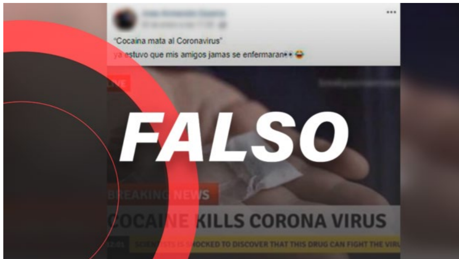
Figura 2. Fake news que indica que la cocaína cura la infección de coronavirus

Con el avance del brote del coronavirus, cada información sobre el número de afectados que publica la OMS, con datos suministrados por el gobierno Chino y su equipo de salud, son puestos en tela de juicio por las grandes cadenas internacionales de noticias, induciendo a la población a dudar sobre estos datos, generando desconcierto, xenofobia y terror. Nuestro país no ha escapado de esto y muchos de los noticieros nacionales, se han hecho eco de estas noticias falsas. Paralelo a ello, llueven cada día sobre este tema en las redes sociales, un verdadero ataque de bioterrorismo, donde incluso, se poseionan viralmente vídeos que muestran ciudades, al parecer Chinas, desoladas, donde las personas fallecen por el "Letal Virus", en grandes cantidades, se pueden observar inclusive que van caminando por las calles o entrando al metro, y caen