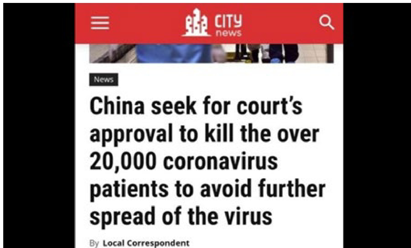
Figura 3. Captura en facebook de una Fake news sobre coronavirus ( https://www.indiatoday.in/world/story/coronavirus-covid-19-sars-cov-2-complete-guide-1649287-2020-02-24 )

lógica preliminar, muestra que la mayoría de los casos eran personas que trabajaban o eran visitantes frecuentes de ese mercado. De allí concluyen que lo más probable es que se trate de un coronavirus animal que ha saltado al ser humano causando un síndrome respiratorio agudo (4) .