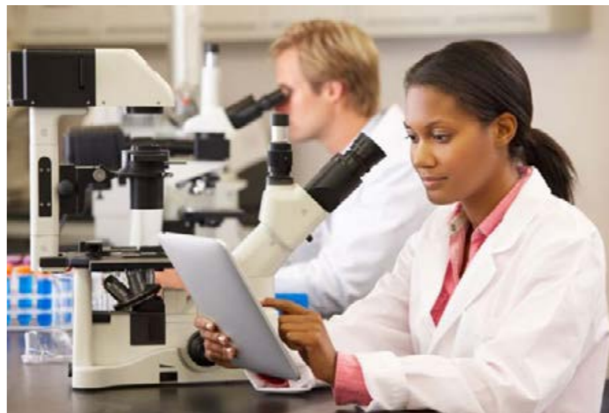
Figura 4. Las mujeres científicas de color, son aún más discriminadas.

En el artículo de Kramer (4) , continuando con su análisis, de diferencia de géneros en publicaciones sobre COVID-19, reportaron un trabajo donde analizaron más de 300.000 artículos denominados pre-print e informes registrados (descripciones de estudios planificados) en todos los campos de la ciencia y encontraron un patrón similar de mujeres que quedaron fuera de las investigaciones recientes: representaban un porcentaje menor, de los primeros autores, en los primeros meses de 2020 que durante los mismos meses del año pasado. Ese hallazgo es significativo, porque