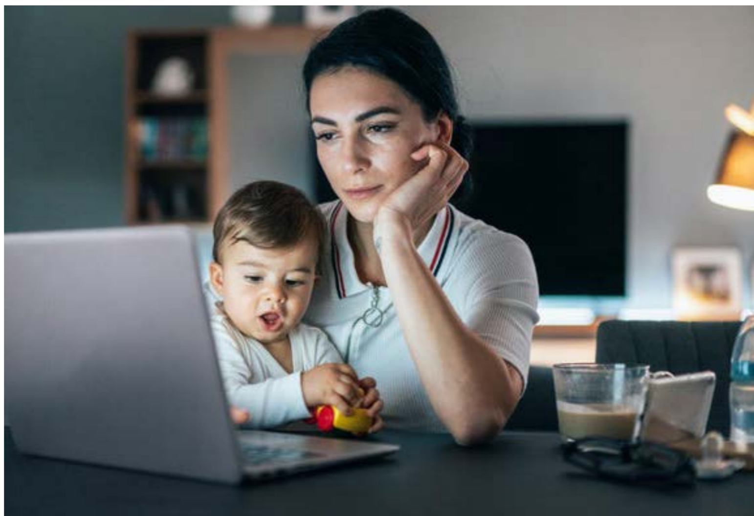
Figura 3. La mujer trabaja y se ocupa de sus hijos.

De este trabajo también concluyen los autores (3) que, en el tiempo analizado en Venezuela, se observaba mayor libertad en la escogencia de carreras que en el pasado y que en otros países, como también lo reconoció la UNESCO con respecto a Venezuela (2) . No encontraron elementos relacionados con una supuesta menor capacidad de las mujeres para estudiar carreras científicas o técnicas, tal como lo indican las cifras