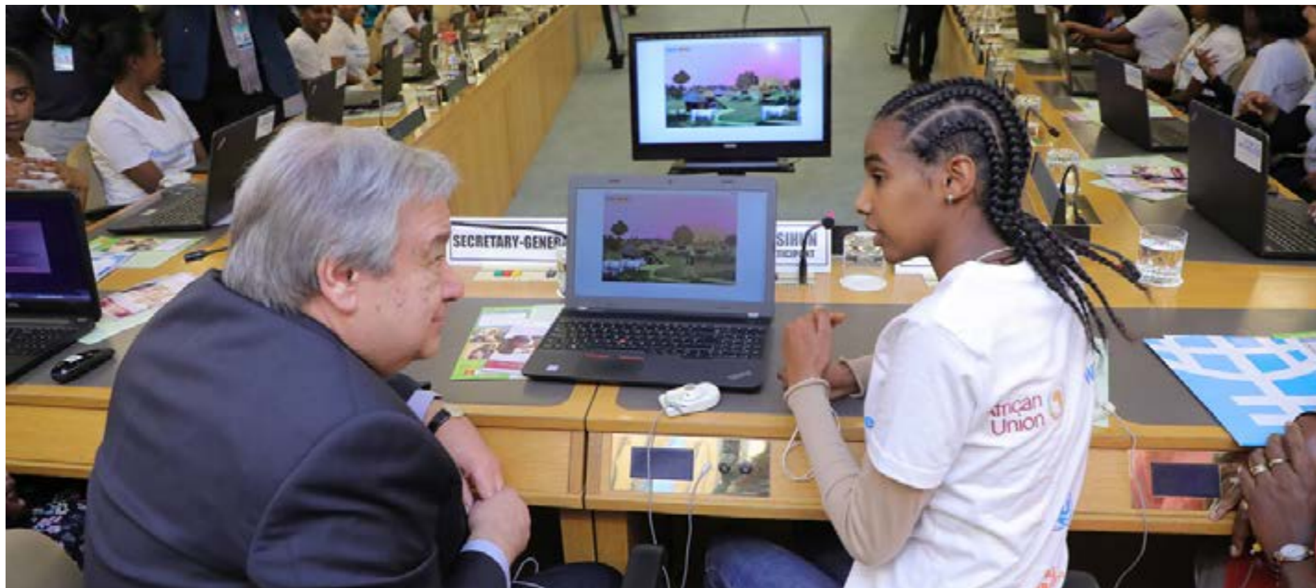
Figura. 1. El Secretario General de la ONU, Antonio Guterres en el evento de ciencia, tecnología, ingeniería y matemáticas centrado en codificación digital durante la 32ª Asamblea de la Unión Africana en Addis Abeba, Etiopía.

algunas áreas científicas y médicas (2) .